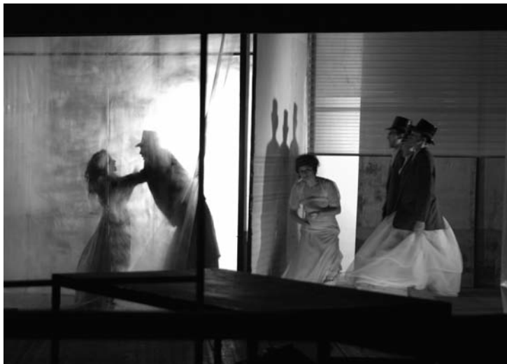
Coda , spectacle de François Tanguy (2005). Ecrans à fantômes, hors technologie, pour renouveler la perception, réapprendre à voir.