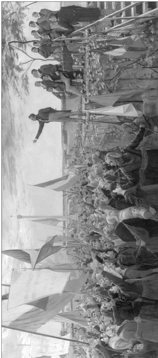
Figure 2 : Charles Alexander, Manifestation des Canadiens contre le gouvernement anglais, à Saint-Charles, en 1837, dite aussi L'Assemblée des six comtés , vers 1891, huile sur toile, Québec, Musée du Québec.