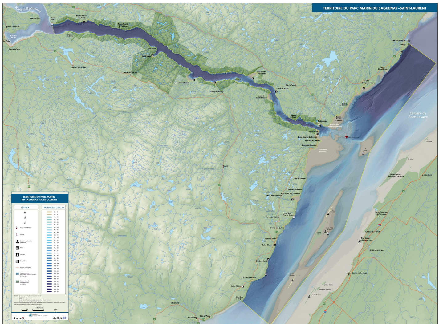
Figure 2. Territoire du parc marin du Saguenay–Saint-Laurent. Territory of the Saguenay-St. Lawrence Marine Park

Couvrant une superficie de 1 246 km 2 , le parc marin du Saguenay-Saint-Laurent comprend toute la colonne d'eau et les fonds marins jusqu'à la ligne des hautes marées ordinaires (Figure 2). Son territoire est entièrement constitué d'écosystèmes estuariens, soit l'estuaire moyen, l'estuaire maritime et le fjord du Saguenay, qui sont tous trois des milieux extrêmement dynamiques. Les caractéristiques physiques et biologiques diffèrent beaucoup entre ces trois portions du parc marin, malgré leur interdépendance (PMSSL, 2008). Par exemple, de récentes études sur les populations de poissons mettent en évidence la connectivité entre les systèmes du Saguenay et de l'estuaire du Saint-Laurent (SÉVIGNY et al. , 2009; SIROIS et al. , 2009).