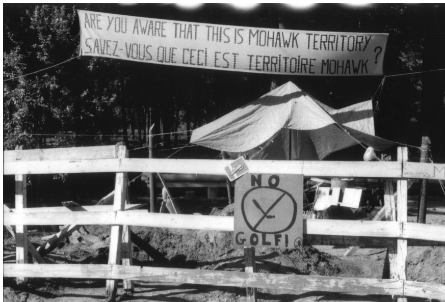
Une fois la crise déclenchée, les barricades se renforcent !

gouvernement fédéral acheta des Sulpiciens les terres restantes, il visait à corriger cette situation inhabituelle : des « Indiens inscrits » résidaient sur des terres privées appartenant à une communauté religieuse plutôt que dans une « réserve indienne ».