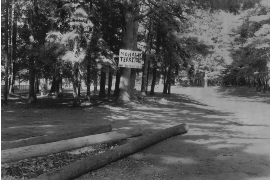
Le calme après la tempête : lieu où s'est produit l'échange de coups de feu