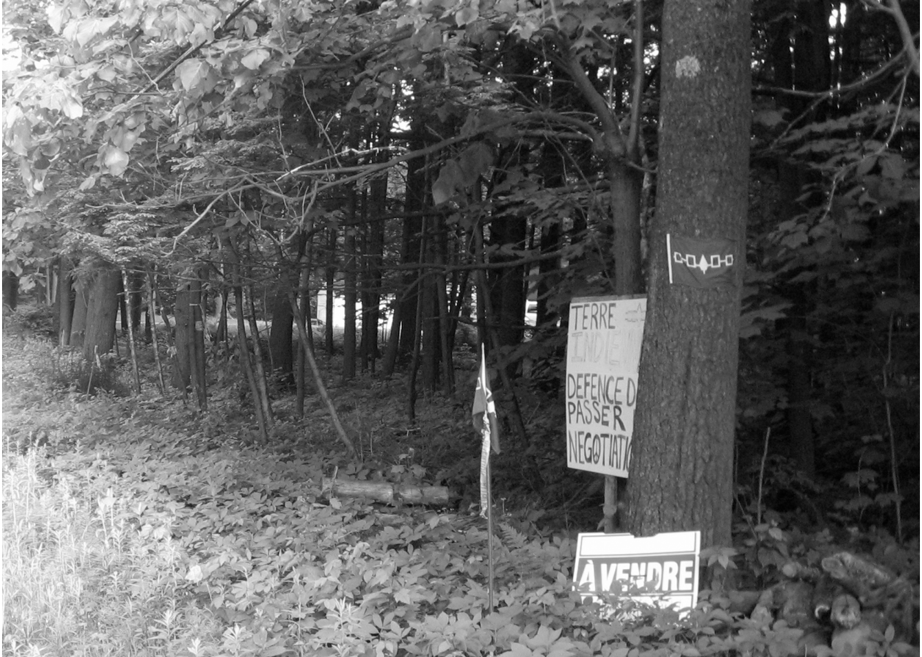
Après les sulpiciens, la compagnie Norfolk tente de vendre des terres litigieuses

particulières ». Ainsi, seules des indemnités financières ou en terres équivalentes sont prévues dans ce type d'entente ; il est également précisé dans cette politique que le gouvernement fédéral ne dépossèdera personne de sa propriété.