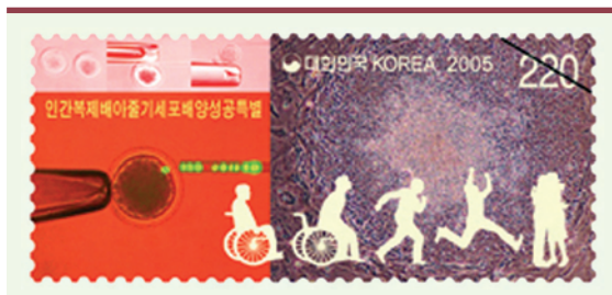
Timbre coréen dédié à W.S. Hwang. Date d'émission : 12 février 2005. Tirage : 1,6 millions d'exemplaires.

La revue Science , elle-même, plaide non coupable, son rédacteur en chef, Donald Kennedy, reconnaissant que le système de revue par les pairs est impuissant devant une fraude préparée avec tant d'art et de minutie [4]. De fait, il semble qu'une atmosphère de secret et d'adoration du chef, digne des meilleures traditions mandarinales, régnait au sein du laboratoire où Hwang contrôlait tout, de l'accès aux cellules, conservées dans une chambre forte, au choix des illustrations, en prenant soin de compartimenter ce que chacun pouvait et/ou devait savoir, lui seul ayant une vue d'ensemble [5]. L'analyse d'un article étant fondée sur la cohérence des résultats, la qualité de l'argumentation issue des données présentées et la confiance dans le fait que les résultats ont réellement été obtenus, la fraude est difficilement détectable. Surtout avec la co-signature d'autorités scientifiques prestigieuses, comme Gérald Schatten, dernier auteur de l'article de 2005.