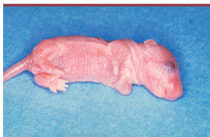
Figure 1. Souriceau nouveau-né fro/fro. La déformation des membres, notamment antérieurs, est très évidente dès la naissance. Le phénotype s'améliorera avec l'âge.

Les enzymes et métabolites de la voie sphingomyéline/céramide interviennent dans de nombreux mécanismes de signalisation, ainsi que dans la régulation de processus cellulaires majeurs tels que la prolifération cellulaire, l'apoptose ou encore la cytodifférenciation.