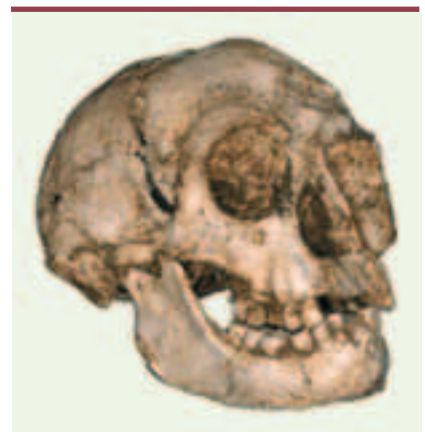
Figure 1. Crâne d' H. floresiensis .

Il subsiste encore bien des interrogations, et certains errements de l'anthropologie dans le passé incitent à la prudence.