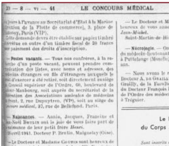
Le Concours Médical, 8 juin 1941.