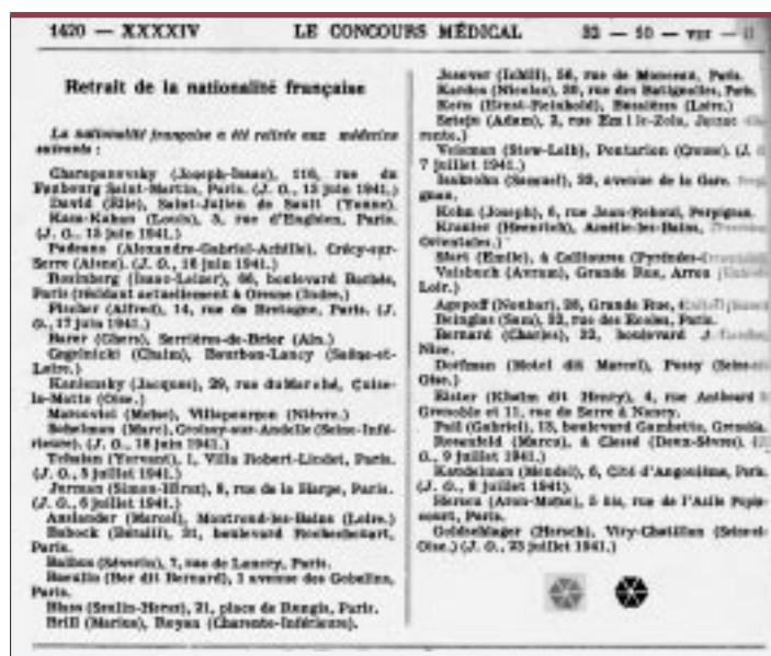
Le Concours Médical , 10 août 1941.

de langage, de sensibilité » et que la loi avait surtout pour objectif d'éliminer une catégorie de médecins étrangers « que nous nous accordons tous à répudier, les circonstances nous en donnent l'occasion; chassons les tard-venus, les non-assimilés, les volées de rapaces qui trop longtemps pillèrent notre grain » [21]. Dans un article intitulé « Où allons-nous? » [22] paru un an après la promulgation de la loi du 16 août 1940, R. Massard expliquait les conséquences sur le corps médical et il manifestait sa satisfaction devant la mise en place de la politique d'exclusion des médecins juifs étrangers: « En exigeant du médecin, pour exercer en France, l'obtention d'être français d'origine, le régime nouveau a apporté aux médecins français un avantage qu'ils réclamaient vainement depuis la Grande Guerre. Nous ne verrons plus ces confrères bizarres, parlant à peine notre langue, qui mettaient les clientèles en coupe réglée, ignoraient la bienséance et la déontologie et avaient envahi la France, en nombre illimité. En réservant notre accueil aux seuls étrangers qui, par leur mérite, leur valeur ou leur courage, se sont élevés au-