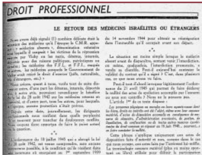
Le Concours Médical , 20 septembre 1945.

Analysis of a well-known medical journal, the Concours Médical reveals the attitude among the French medical corps between 1940 and 1944. This journal kept its readers informed of the various stages of xenophobia and anti-Semitism under the Vichy government. It provided the decisions adopted, and the application of measures prohibiting foreign and Jewish physicians to practice, regularly publishing lists. Analysis of the editions published under the occupation clearly shows the xenophobia and anti-Semitism that existed among a certain population of French practitioners. ♦