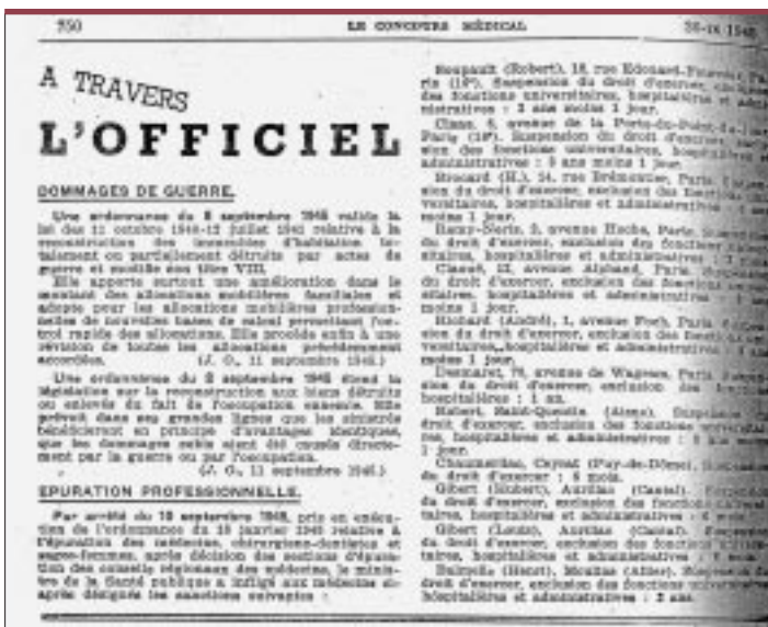
Le Concours Médical, 30 septembre 1945.