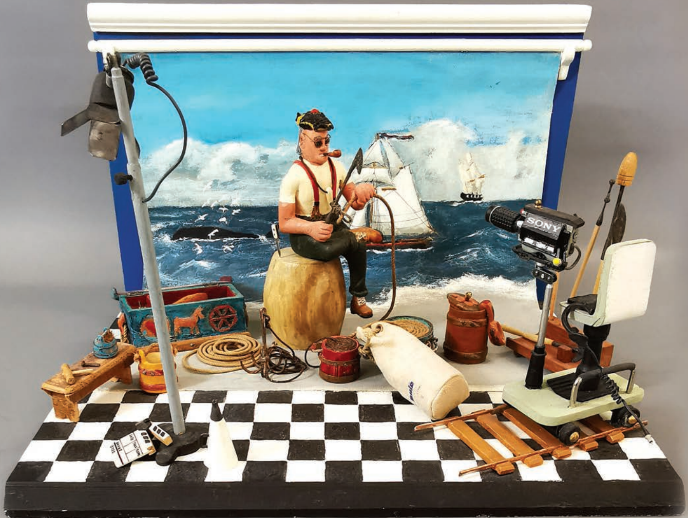
Quinze de Gaspé, Chasseur de baleine en pause , peinture sur bois, 29 x 43 x 35,5 cm. Musée de la Gaspésie. Don de l'artiste