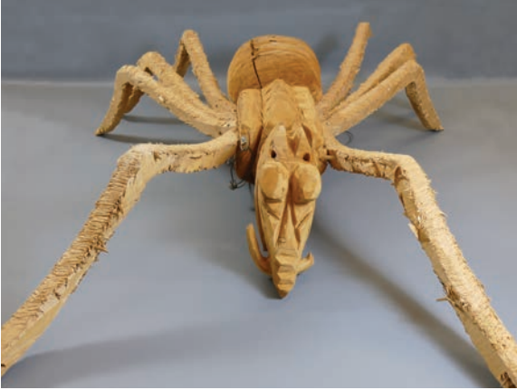
Réjean Pipon, Bibitte , bois naturel, 156 x 120 cm. Musée de la Gaspésie

réduit est un saisissant témoignage de la vie quotidienne et met en scène des petits personnages répétant des gestes appris de génération en génération. Une précieuse illustration du mode de vie des habitants de Forillon, de la main d'un artiste lui-même profondément enraciné au territoire de la région.