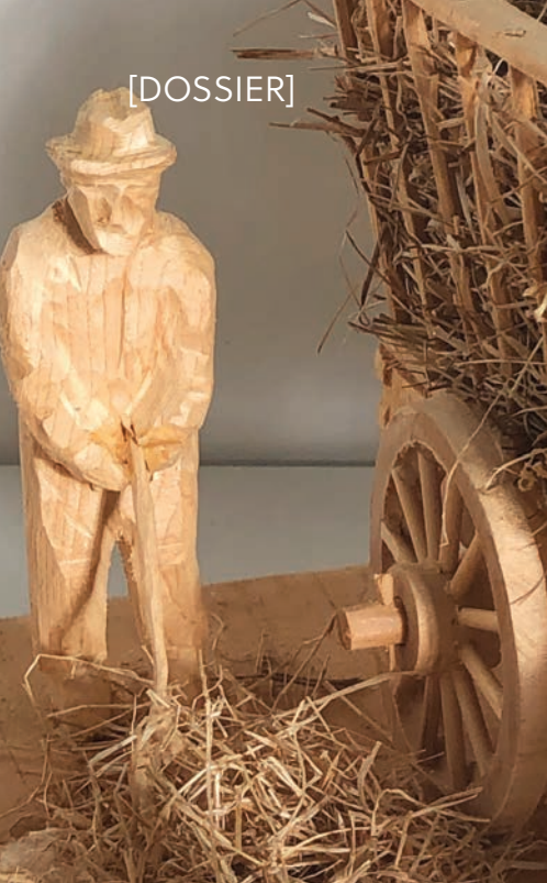
À gauche : Réjean Pipon, détail de L'agriculture , bois naturel, 35 x 20,5 x 22 cm, 2010. Parcs Canada