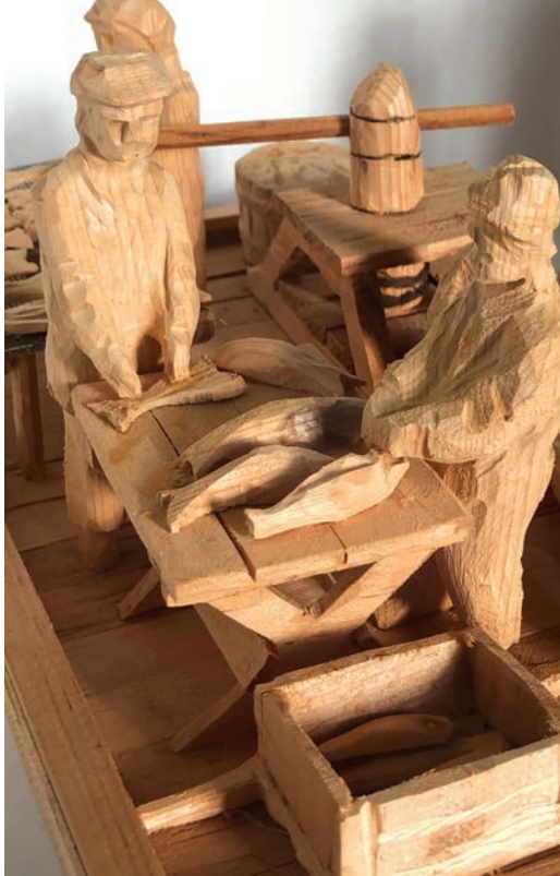
À droite : Réjean Pipon, détail de La pêche , bois naturel, 35 x 20,5 x 15 cm, 2010. Parcs Canada

où les changements se multiplient à un rythme effréné. « Il s'agit d'un élément nouveau de l'art populaire, qui n'avait pas sa raison d'être quand la société était traditionnelle, stable, durable. » 3