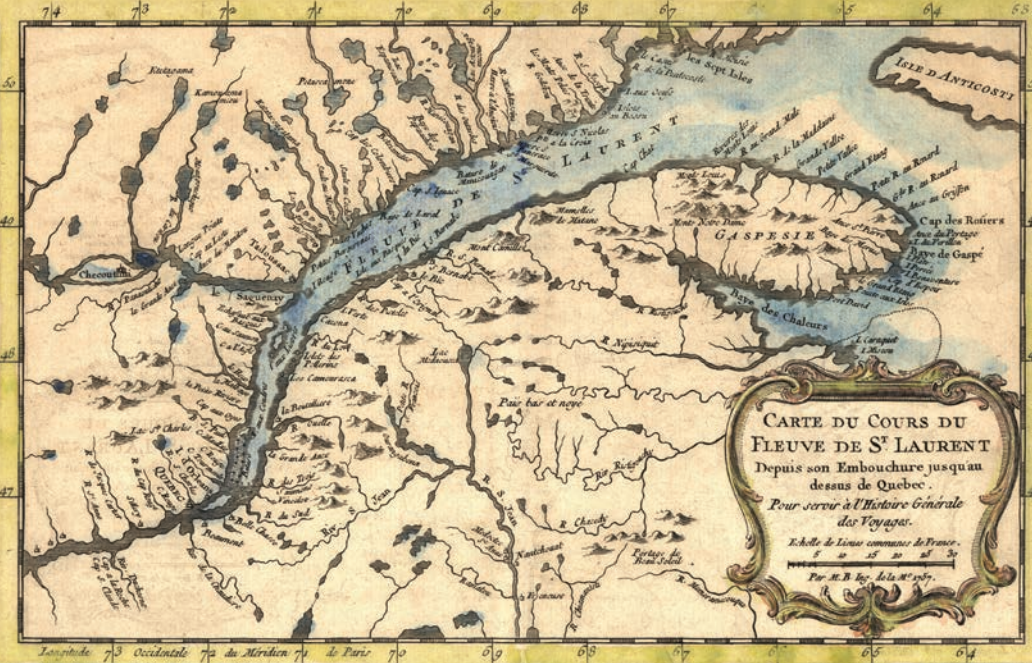
Carte « du cours du fleuve de Saint-Laurent », 1757. P162/5

pour la réparation de la maison du commandant.