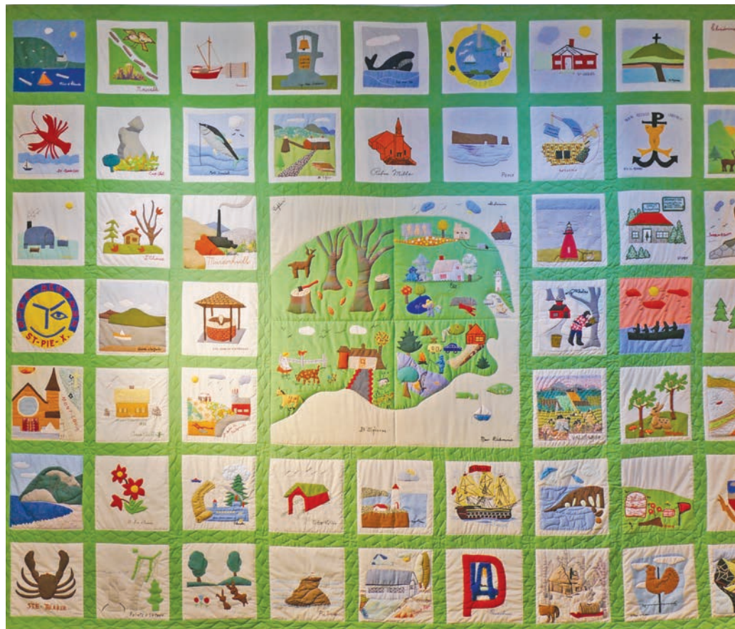
Courtepointe représentant les différents blasons des Cercles de Fermières en Gaspésie, 1979. La péninsule représentée au centre a été utilisée en couverture de la publication Histoire orale en Gaspésie de Carmen Roy.

De 2016 à 2020, dans le cadre du programme Nouveaux horizons pour les aînés , le Cercle de Fermières de Gaspé reçoit des subventions lui permettant de se procurer métiers, machines à coudre, surjeteuse et ameublement. Cet équipement permet de réaliser un plus grand nombre