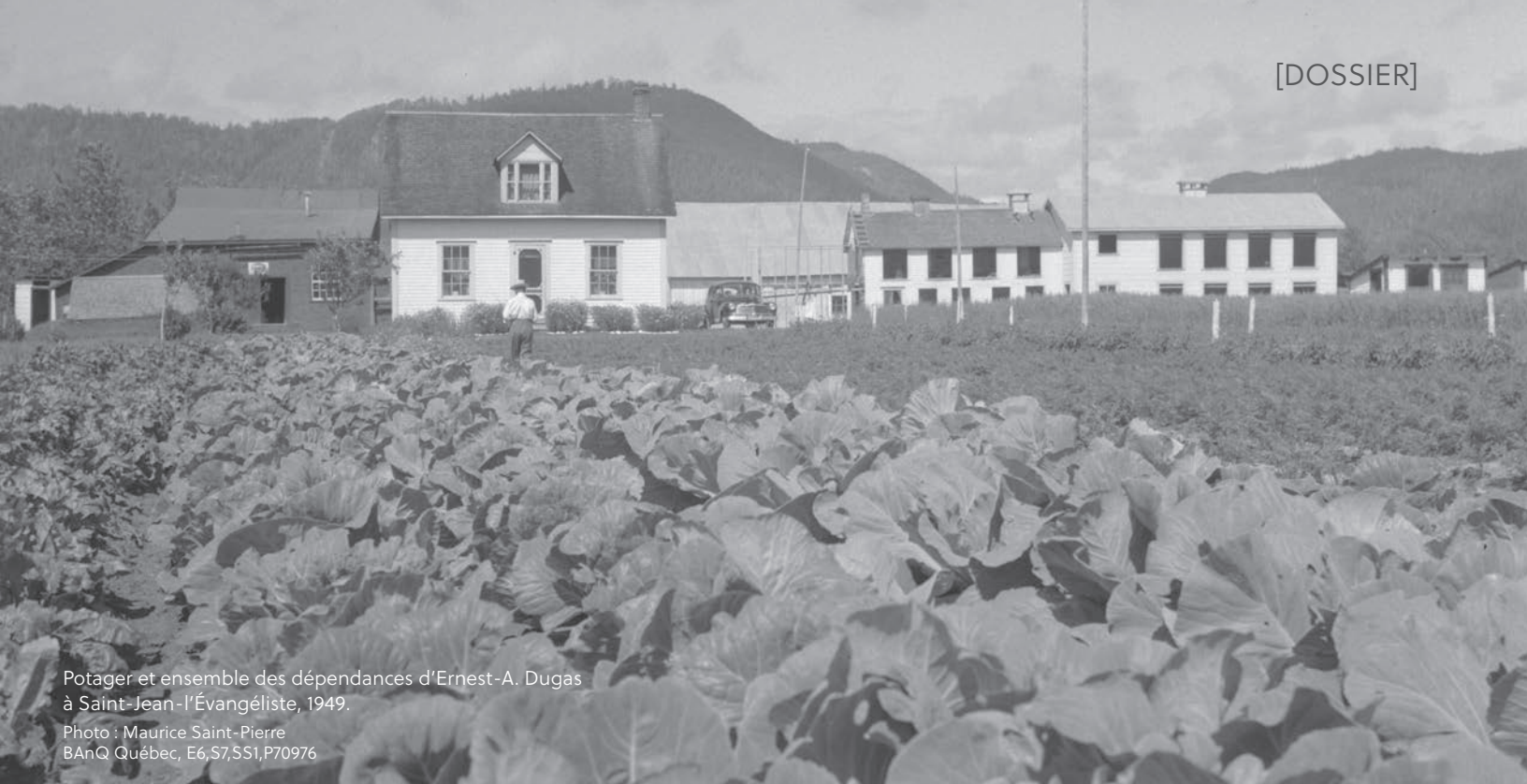
Potager et ensemble des dépendances d'Ernest-A. Dugas à Saint-Jean-l'Évangéliste, 1949.

E6,S7,SS1,P70976