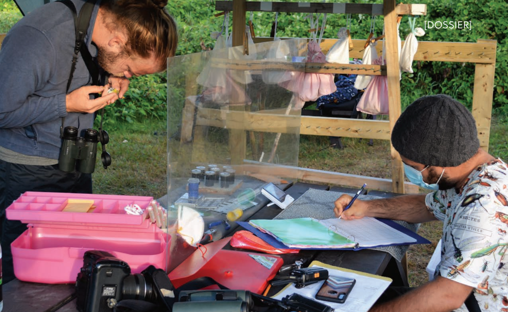
Un bagueur mesure la quantité de gras d'un oiseau devant son scribe, 2020. On aperçoit au fond les sacs contenant des oiseaux qui attendent d'être bagués.