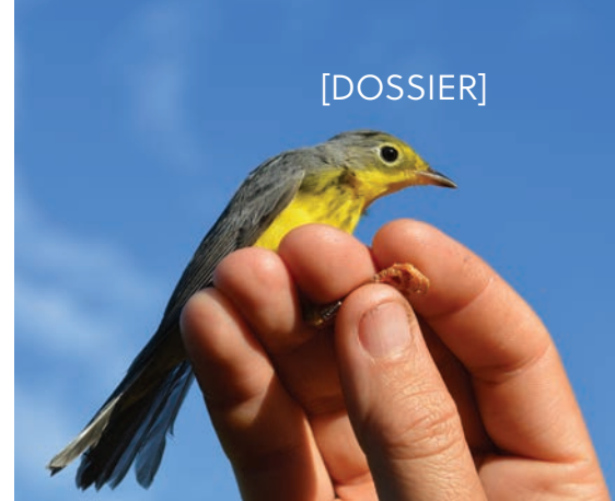
Cette paruline du Canada porte sa nouvelle bague d'identification à numéro unique, 2020.

En plus de la station de baguage, le suivi des oiseaux migrateurs de Forillon vient de se faire un allié de taille : la télémétrie. En collaboration avec Environnement et Changement climatique Canada, le parc national Forillon a récemment installé une antenne Motus à Cap-Gaspé. Elle permet de mieux documenter le trajet des oiseaux migrateurs qui passent par le parc et ses environs. Les antennes Motus détectent des émetteurs équipés sur le dos d'oiseaux. C'est le réseau