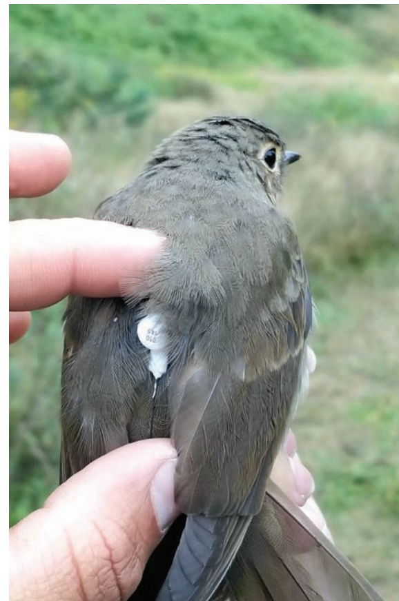
Grive à dos olive équipée d'un émetteur ultraléger, 2020.

À 10 h 45, on ferme le dernier filet, un peu essoufflé. L'équipe n'a pas chômé. Ce matin-là, c'est 224 oiseaux qui ont été bagués. Aussi bien dire que l'équipe n'a pas eu le temps de contempler le