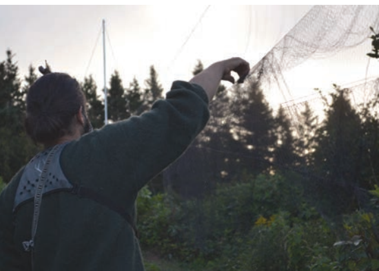
Filets japonais servant à attraper les oiseaux, 2020.