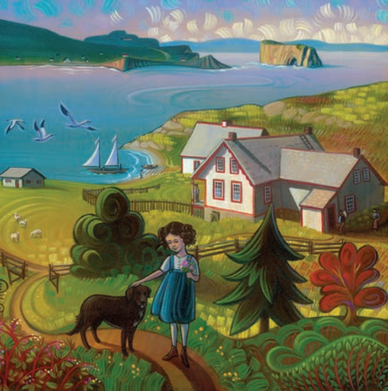
Mylène Henry, Autrefois à l'île Bonaventure , acrylique sur toile, 2016. Collection Terrence Langlois