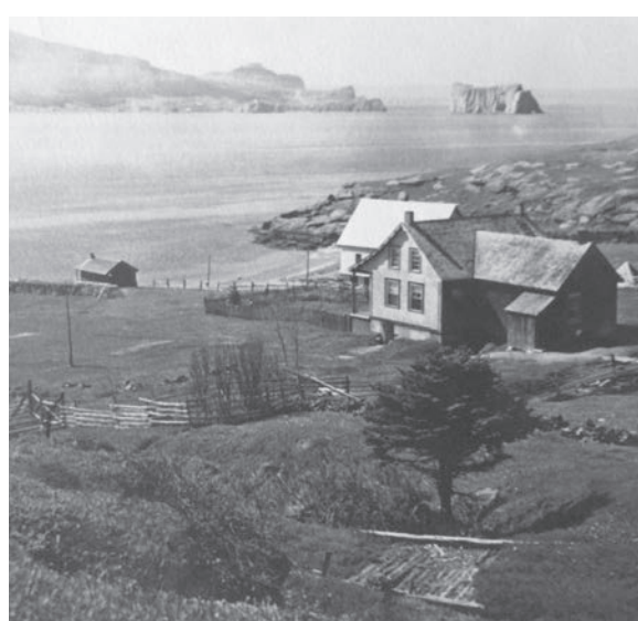
La maison Le Bouthillier sur l'île Bonaventure, 1934.