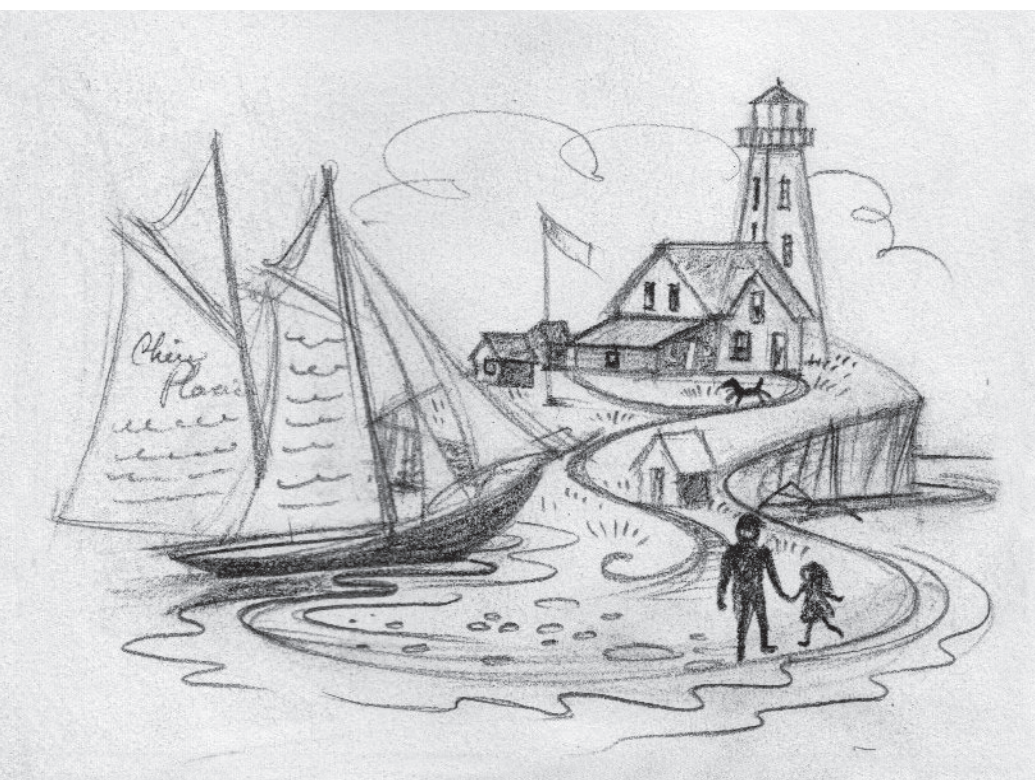
Première esquisse pour L'île aux Perroquets , 2019. Collection Mylène Henry