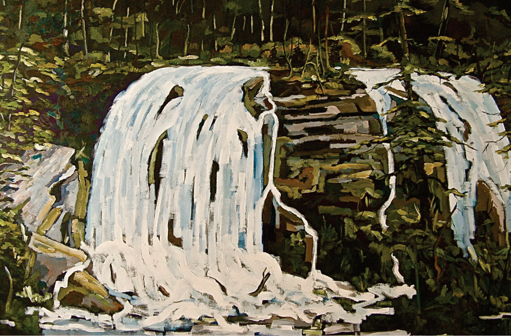
Claude Paquette, détail de Les deux sœurs , acrylique sur toile, 121,9 x 182,9 cm, 2013. Collection de l'artiste