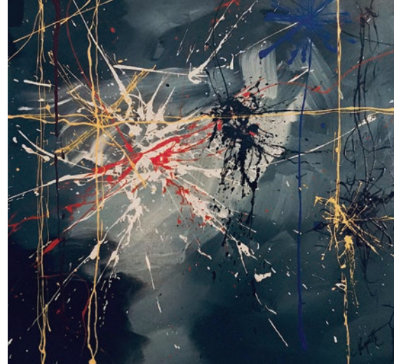
Claude Paquette, Navy Blues , acrylique sur toile, 91,4 x 91,4 cm, 2017.

Aujourd'hui, l'homme de 75 ans me raconte qu'il n'a jamais voulu intellectualiser son art, le mettre en mots. Il n'a jamais non plus aspiré à la célébrité, non pas que ce milieu ou la richesse l'intimide, mais simplement parce que ça ne l'intéresse pas. Il me confie être plus à l'aise avec un pinceau