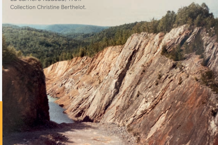
La carrière Nadeau, 1981.

JA & L Nadeau inc. est fier de soutenir le Magazine Gaspésie!