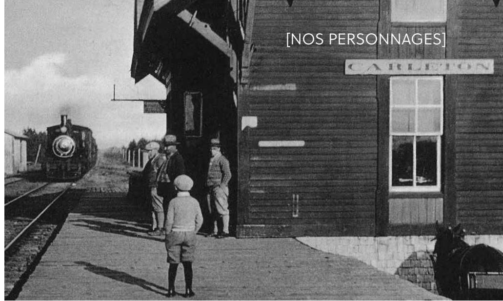
Gare de Carleton, vers 1930. Les noms des cantons de Carleton et Maria sont proclamés en 1842. Musée de la Gaspésie. Collection de cartes postales. P169

Dorchester contribue peu à l'élaboration par Londres d'une nouvelle constitution pour le Canada, soit l'Acte constitutionnel de 1791. Il