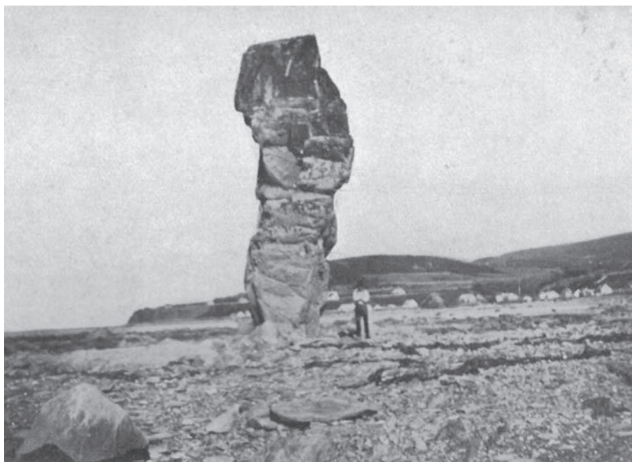
Une sentinelle robuste à Tourelle.