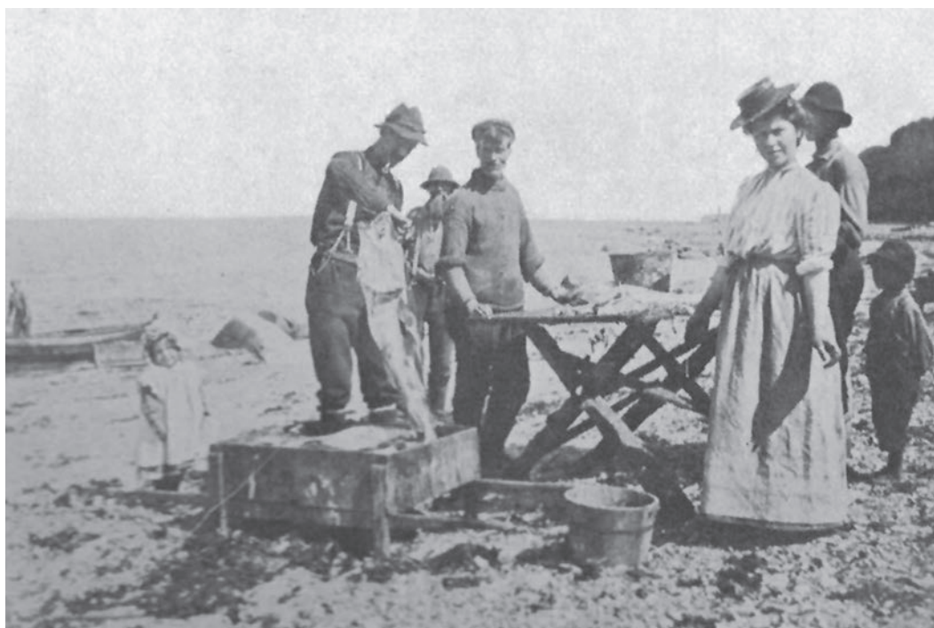
En compagnie de pêcheurs.

Photo : Effie Bignell. Tirée de St. Anne of the Mountains , 1912, p. 144a.