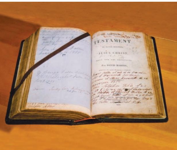
Chez les Jersiais anglicans comme George Fallu, leur bible est en français en raison de leur origine anglo-normande et on y inscrit des notes sur l'histoire de la famille.