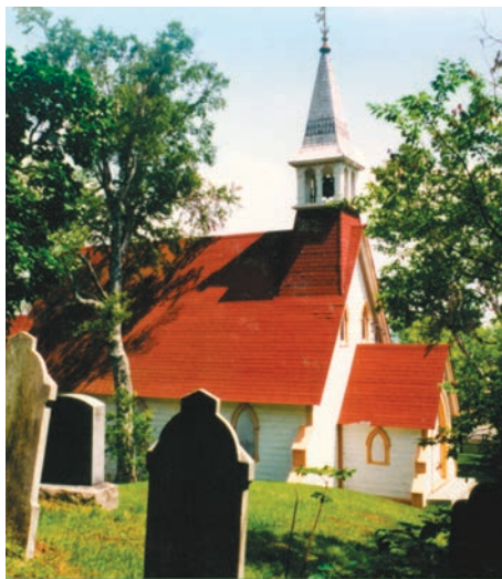
L'église anglicane St. Luke de Coin-du-Banc en 1998.