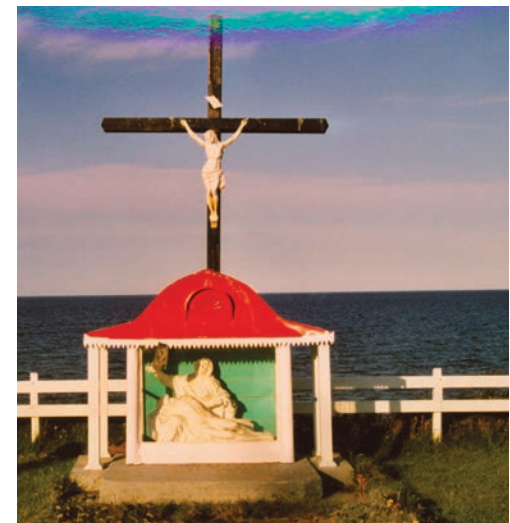
Magnifique calvaire représentant Notre-Dame-de-Pitié surplombant la mer au « Cimetière des anciens » de Cap-des-Rosiers, érigé en 1881. Photo : Jean-Marie Fallu, 2003.

« Girl's Friendly Society », etc. Lors des « Sunday Schools », on professe des leçons de catéchisme soit avant soit après le service dominical.