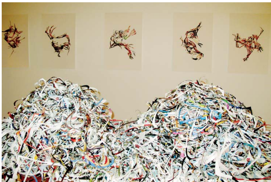
> Action/Suspension , Action Art Actuel, 2007.