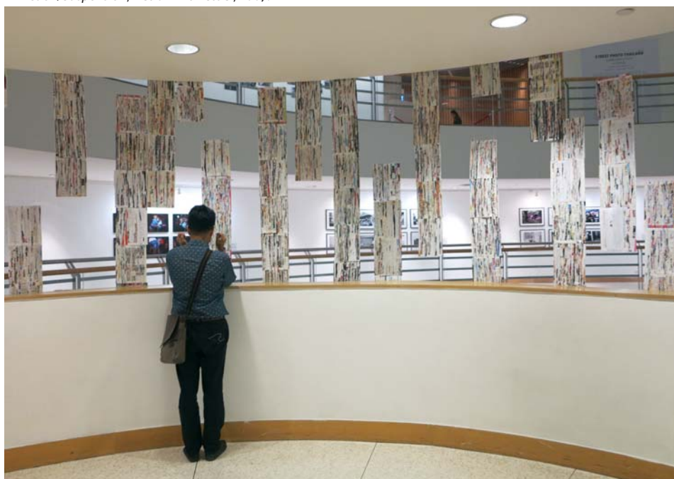
> Break to Make , Bangkok, 2015.