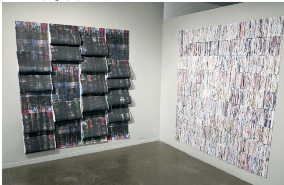
> Refaire surface , MSVUAG, Halifax, 2015.

lient d'affinité dans l'effort acharné, trouvent une réciprocité dans les corps penchés sur l'ouvrage. En tout, 50 kilogrammes de revues subissent le procédé d'extraction obstiné de l'artiste, une délicate mutilation faisant disparaître les images et leurs simulacres, visages pantois et objets de convoitise, déconstruisant pour laisser apparaître comme seul support un papier-matière meurtri. Les surfaces sensibles, texturées, une fois agencées les unes aux autres, créent les pièces de Break to Make , une immense installation in situ exposée au cœur du BACC.