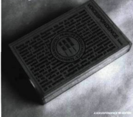
Robert Filliou The Gong Show