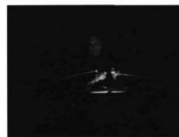
> Maxime Rioux, Assemblée phosphorescente . © Maxime Rioux et Richard Coulombe.

D'octobre 2007 à février 2008, La chambre blanche présente La collection 2 en ayant recours à des artistes qui se servent de leur voix pour répondre aux tableaux. ■ www.chambreblanche.qc.ca