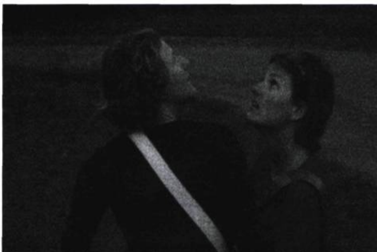
> CityHACK, 2006.

projet artistique a un effet révélateur sur la composition idéologique et culturelle d'un espace. L'espace public apparaît alors comme une forme qui porte l'empreinte d'une mentalité, l'empreinte d'une conscience sociale. Un projet tel CityHACK est un révélateur de la relation des individus à leur environnement. Tout d'un coup un monde policé, rationnel, se révèle habité par le caprice, traversé par des phénomènes mystérieux. C'est une forme d'animisme, il semble que les lumières et les sons ont leur conscience propre, qu'ils font signe.