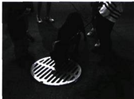
> Par leurs os , 1998.

MLC : Nous avons une conscience accrue aujourd'hui, avec la médiologie, du rôle des équipements et de l'infrastructure sociaux. Nous savons que les infrastructures, la forme des relations humaines, déterminent les superstructures et notre façon de penser. Lorsque vous intervenez directement sur l'infrastructure, vous déstabilisez des repères très importants.