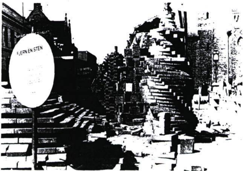
THE MOVEABLE WALL, une sculpture déplacée par les citoyens, 10,000 pierres - 40 tonnes.

Quand quelqu'un déplaçait une brique à une des extrémités, une autre brique était placée exactement à la même place à l'autre bout. Le mur s'est déplacé de 6 mètres durant la semaine en prenant différentes formes. Eric Andersen.