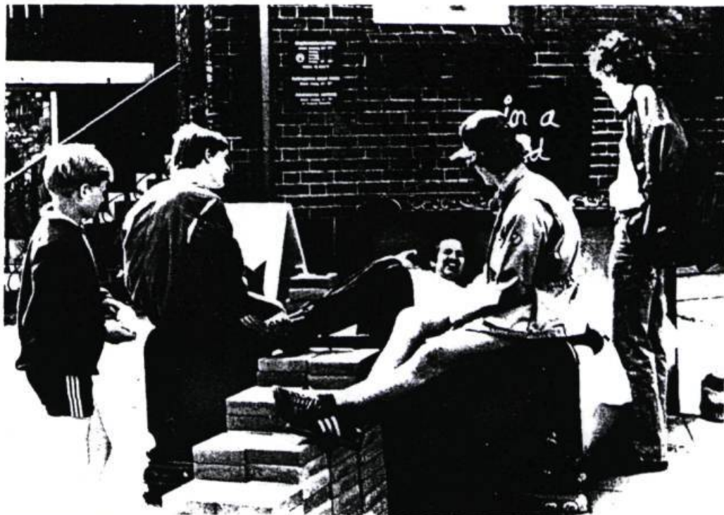
Ben Vautier pour une semaine au Town Square.

que au lyrique et même jusqu'à la parodie du poème lyrique, traitant sur bon nombre de points. Et les moyens employés pour mener à bien de telles réalisations sont importants, seulement parce qu'ils contribuent en fait à leur réussite.