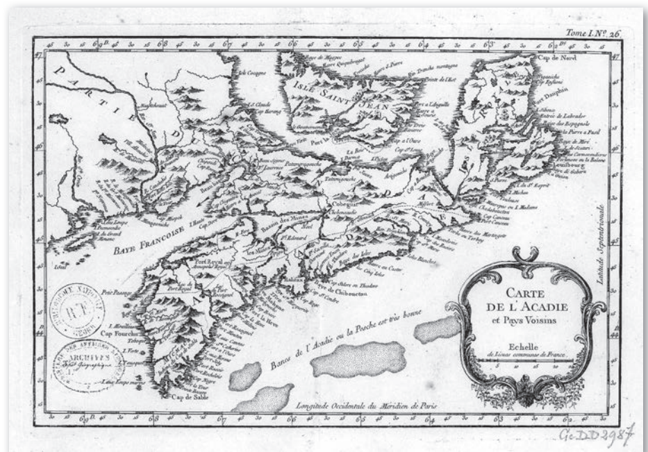
Carte de l'Acadie, Isle Royale, et Pais Voisins... 1757. (Source : Jacques Nicholas Bellin N6700120)

La région de Cacouna et de L'Isle-Verte reçoit deux groupes de réfugiés en 1759 et 1763. Le premier arrive de la rivière Saint-Jean, le second de Sainte-Anne (Frédéricton). Le premier groupe quitte Cacouna pour Bécancour au printemps suivant. Les membres du second groupe vont