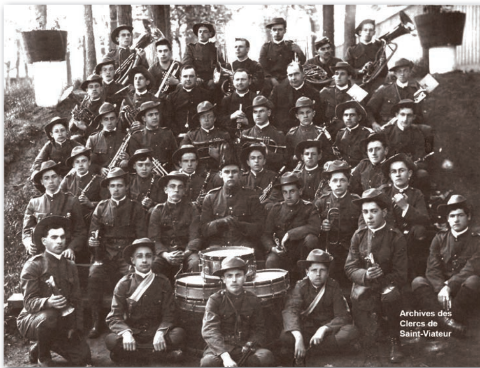
Photographie de l'Harmonie du Collège Joliette en 1913-1914. L'institution collégiale était alors dirigée par les Clercs de Saint-Viateur.