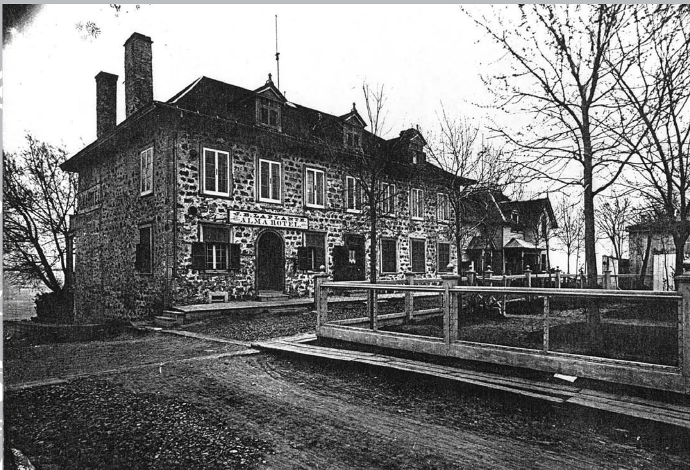
Deuxième tracé du chemin du Roy au village de la Pointe-aux-Trembles sur la rue Saint-François, devant l'Hôtel Alma, détruit lors du grand incendie de 1912. Ce tronçon de 100 mètres existe toujours sous le nom de rue Bellerive.

Le chemin du Roy fut enfin praticable sur toute sa longueur en 1737. Les voyageurs se plaignaient souvent pendant du mauvais état de la route, tant