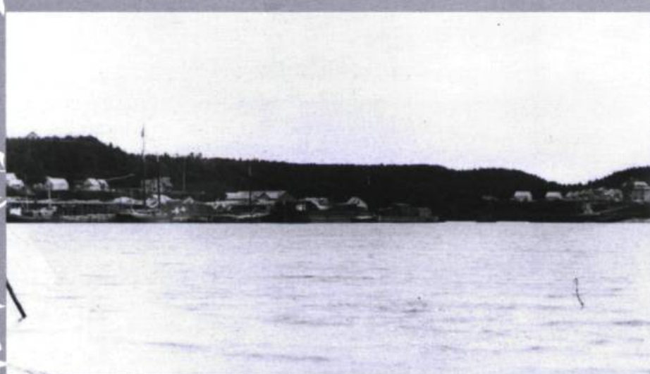
Vue du village de Bergeronnes. Près de la rivière, une installation forestière.

Le même Thomas Simard, « un homme riche », note Duberger, est aussi bien installé aux deux extrémités de la vallée des Petites-Bergeronnes. À l'embouchure, près du fleuve, il s'est fait construire une grande ferme. On y retrouve « trois maisons, une grange, un magasin et des étables » où vivent six ou sept familles. Pour lors, logées et engagées par l'entrepreneur, elles sont vivement intéressées à s'établir à leur compte du côté des Grandes-Bergeronnes, plus à l'est. Après le rachat des droits de la Compagnie de la Baie d'Hudson, qui avait l'habitude de ramasser du foin dans cette vaste plaine naturelle pour approvisionner son poste de Tadoussac, Simard se heurte à une difficulté tout à fait imprévue : ses installations sont entièrement inondées lors des grandes marées de novembre! Duberger lui-même doit quitter, au milieu de la nuit, une des maisons où l'eau monte « à trois pieds et [ils furent] bien aise d'avoir [leurs] canots et chaloupes pour échapper à un bain froid ». À l'autre extrémité de la vallée, à quelque cinq kilomètres de l'embouchure, M. Simard possède, en plus, un « moulin à plusieurs scies » avec ses écluses. Il est donc bien installé aux deux extrémités de la rivière.