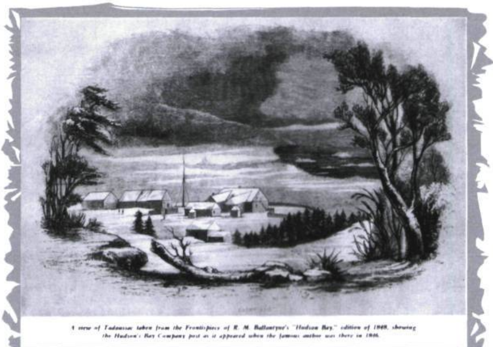
A view of Tadoussac taken from the Frontispiece of R. M. Ballantyne's "Hudson Bay," edition of 1848, showing the Hudson's Bay Company post as it appeared when the famous author was there in 1846.