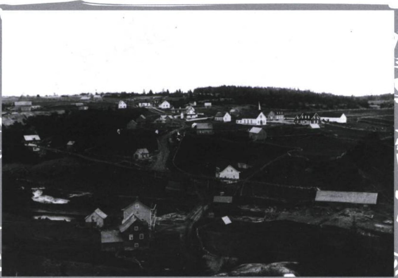
Partie nord de la Baie des Escoumins représentant le moulin, la maison du gérant, le magasin et quelques maisons des ouvriers.

tions forestières et agricoles qui allaient modeler, pour de bon, le profil d'occupation de ce territoire.