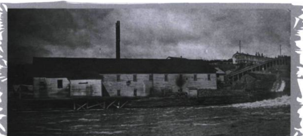
Moulin à scie de Sault-au-Mouton, vers 1920.