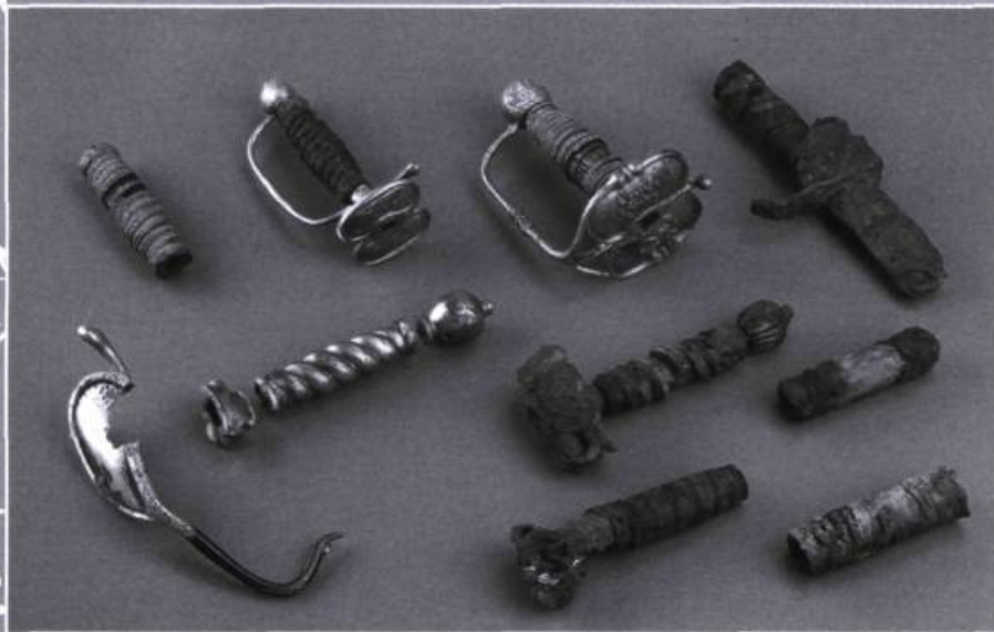
Échantillonnage de manches et de gardes d'épées.

entre les différentes personnes impliquées dans le projet. Toutes se sont donné corps et âme et ont partagé la même passion. Celle-ci s'est transmise aux différents organismes partenaires dans cette aventure. Le ministère de la Culture et des Communications du Québec, le Centre de conservation du Québec (CCQ), le Groupe de préservation des vestiges subaquatiques de Manicouagan (GPVSM), la Municipalité de Baie-Trinité, la MRC de Manicouagan et Parcs Canada ont tous mis l'épaulé à la roue pour atteindre leur objectif commun.