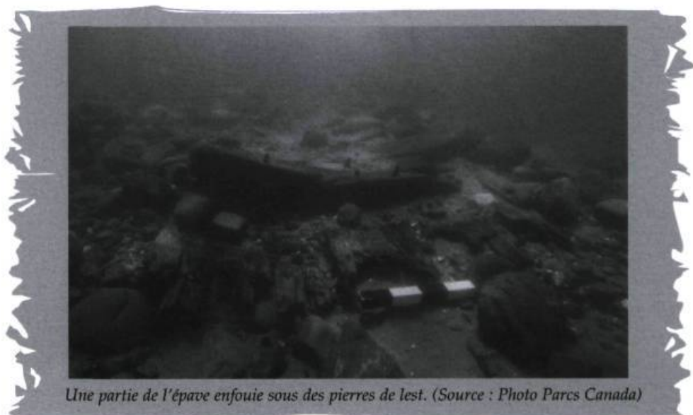
Une partie de l'épave enfouie sous des pierres de lest.

Étant donné l'importance de la découverte, une première intervention prenait place en juin 1995 sous l'habile direction de Marc-André Bernier de Parcs Canada. Vingt-deux plongeurs amateurs, tous bénévoles, reçurent une formation spéciale afin de dresser le plan détaillé du site et de faire un inventaire du contenu apparent.