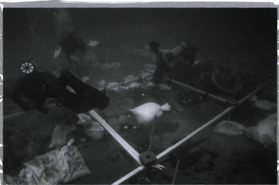
À chacun son carré de fouille.

Le grand succès de la fouille de l'anse aux Bouleaux revient à l'incroyable dynamique créée