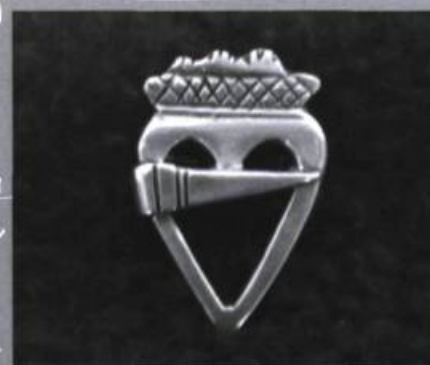
Le cœur du Saint-Laurent.