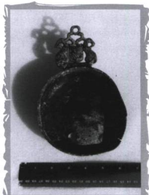
L'écuelle de Increase Mosley, le jour de sa découverte.

http://www.mcccf.gouv.qc.ca/phips/phips1.htm