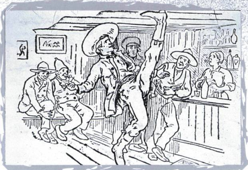
Le légendaire Joseph Montferrand et son coup de pied au plafond d'une taverne. Dessin d'Henri Julien (?). Collection Pierre Louis Lapointe.

P o u r « Squire Wright », la possession du sol demeure son objectif premier. À sa mort, survenue en 1839, il a gagné son pari, puisque sa famille immédiate possède plus de 36 000 acres de terre dans les cantons de