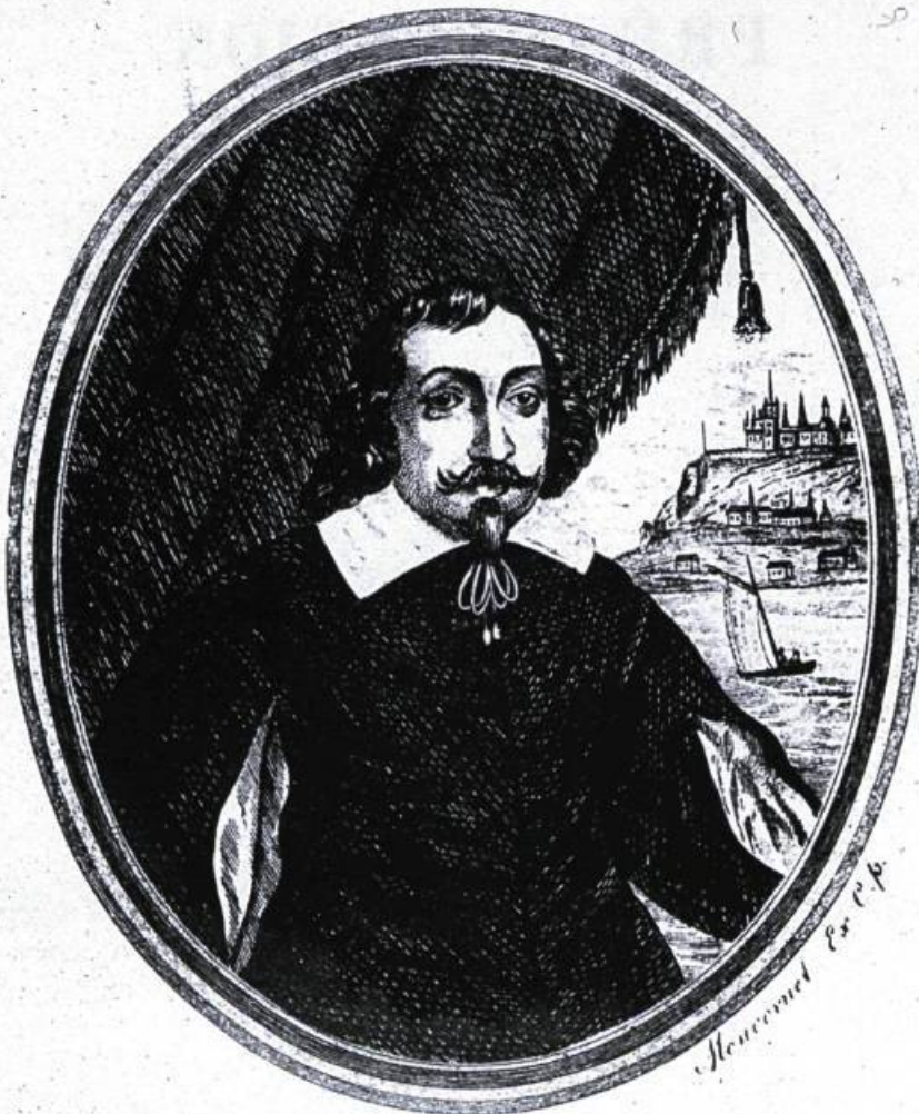
SAMUEL DE CHAMPLAIN Fondateur de Québec Capitale du Pays de Canada 1608

Plusieurs postes de traite jalonnent la « Grande rivière » jusqu'au milieu du XIX e siècle, comme autant de marqueurs qui rappellent l'importance considérable du commerce des fourrures dans l'Outaouais. Les principaux sont alors situés au lac des Deux-Montagnes (Oka), aux Chats (Quyon), au Fort Coulonge, au lac des Allumettes (Fort William), à des Joachims, à Mattawa et au Témiscamingue. Deux des plus importants, ceux de Fort-Coulonge et de Témiscamingue, remontent à l'époque de la Nouvelle-France. D'autres, moins importants et surtout moins connus, ont marqué pour un bref moment l'histoire de la région de Hull. C'est le cas de celui de Deschênes, auquel sont intimement liés Ithamar Day et les McConnell. Le commerce des fourrures, qui connaît son apogée sur l'Outaouais vers 1850, disparaît peu à peu, ruiné par la montée du mouvement de colonisation et le développement de l'industrie du bois. C'est