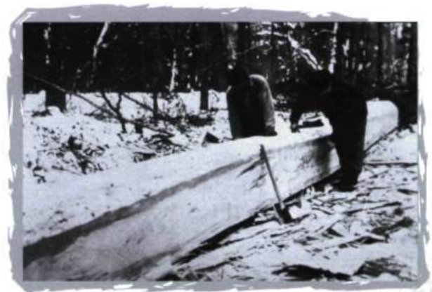
Équarrissage d'une pièce de pin, vers 1920.

et danser les marionnettes, « des espèces de lumières malfaisantes qui se montrent dans le Nord quand on est pour avoir du frette ». « Ça pétille... ça s'étire et ça se beurraille dans le ciel... comme si le diable brassait les étoiles en guise d'œufs pour se faire une omelette. » Fifi Labranche les a vues danser. Moi aussi. « Son violon en est resté ensorcelé pour plus de trois mois. » La Babiche savait « zitanies de sorcier », pour faire venir les marionnettes. Labranche les a fait danser en jouant le Money Musk. Elles sont venues