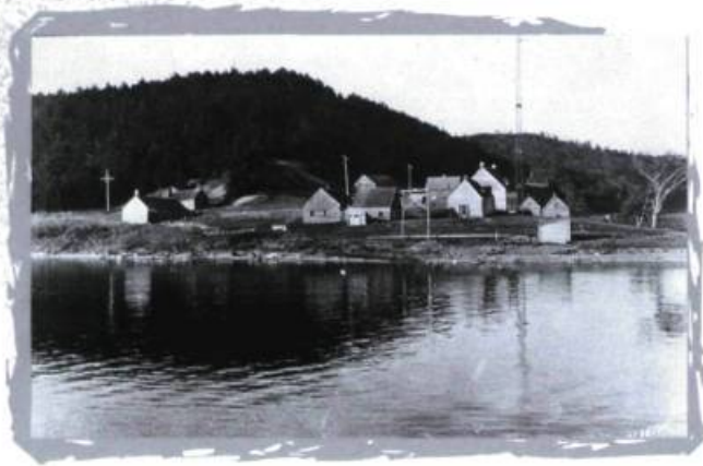
Un vestige de l'épopée de la traite des fourrures. Le « Vieux fort » du lac Témiscamingue vers 1930. Collection Pierre Louis Lapointe.

ainsi que ferment tour à tour les postes des Chats (1837), de Fort Coulonge (1855), de Fort William (1869) et le « Vieux Fort Témiscamingue » (1891), situé près de Ville-Marie.