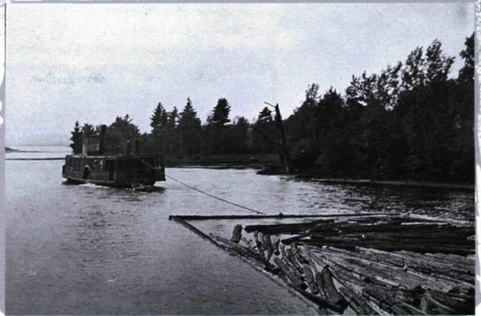
Remorquage de bois dans des estacades, région du Pontiac, vers 1906.