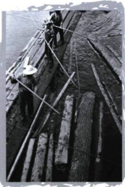
Opérations de triage de bois près de Bryson, vers 1910.

La rivière, axe de pénétration et outil de développement de l'ensemble de la vallée, devient éventuellement frontière. Peu à peu, les institutions