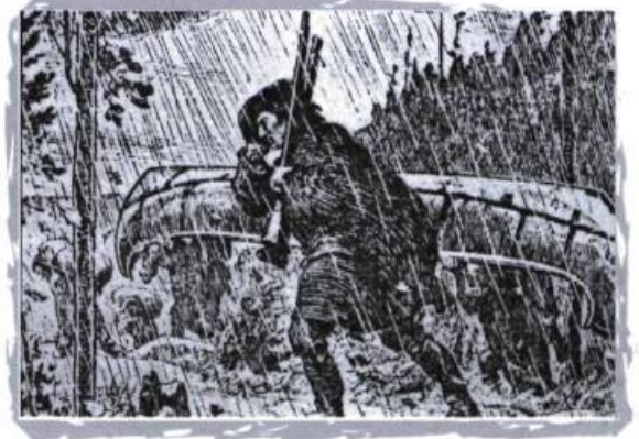
Dessin de Jeffries. Reconstitution du passage d'un sentier de portage. Collection Pierre Louis Lapointe.

« Ça se passe, dit-on, à l'époque des guerres iroquoises... Un groupe d'Algonquins campe sur les rives du lac des Fées (ou lac Hanté) épiant l'occasion d'attaquer les Iroquois... Parmi ceux qui s'y trouvent, il y a une belle princesse amérindienne que fréquentent assidûment deux jeunes et valeureux guerriers. Chacun d'eux rivalise d'ardeur et de promesses pour gagner le cœur de la belle. Mais elle tergiverse de l'un à l'autre, incapable de prendre une décision.