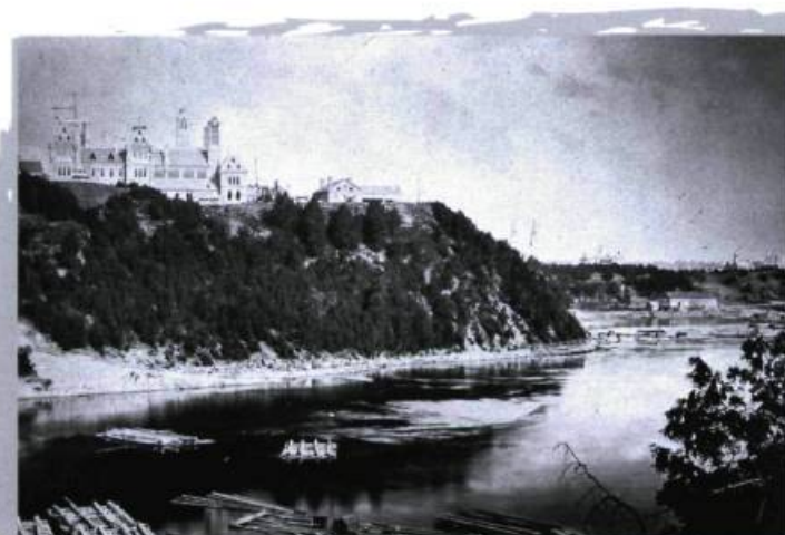
Rivière des Outaouais et radeaux de bois « carrés » avec en arrière-plan les édifices du Parlement en construction, vers 1860.

et à sa couronne périurbaine, et l'autre correspondant aux MRC Pontiac, Vallée de la Gatineau et Papineau, dont les caractéristiques