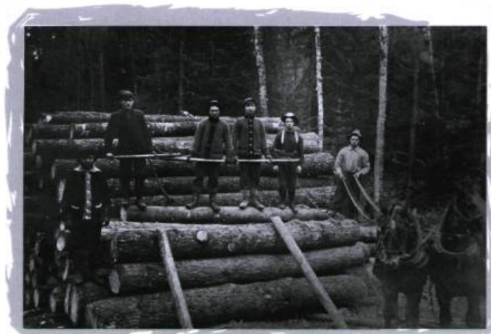
Empilage de billots, Outaouais, vers 1915.

On oublie trop souvent qu'il existe deux Outaouais, l'un fortement urbanisé et relativement prospère correspondant à la ville de Gatineau