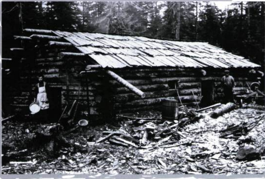
Chantier forestier typique, Haute-Gatineau, vers 1910.

La version canadienne de la légende de la chasse-galerie, telle que publiée par Honoré Beaugrand, met en scène Baptiste Durand, le contremaître d'un chantier de la Gatineau, qui suggère à quelques-uns de ses compagnons d'aller veiller avec leurs blondes à Lavaltrie.