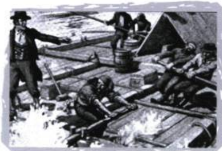
Dessin de Jeffries. Reconstitution de la descente du premier radeau de bois de l'Outaouais, le « Colombo », jusqu'à Québec.

Cette expérience se révélant un vif succès, c'est le signal de départ de l'industrie du bois dans l'Outaouais. Des imitateurs surgissent de partout et des scieries (pour scier du madrier surtout) voient le jour tout le long de l'Outaouais et de ses tributaires, à