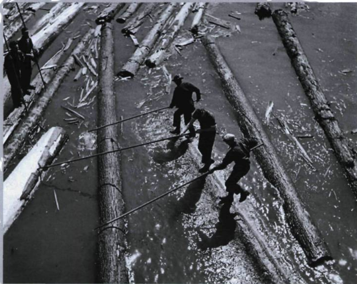
Draveurs au travail.