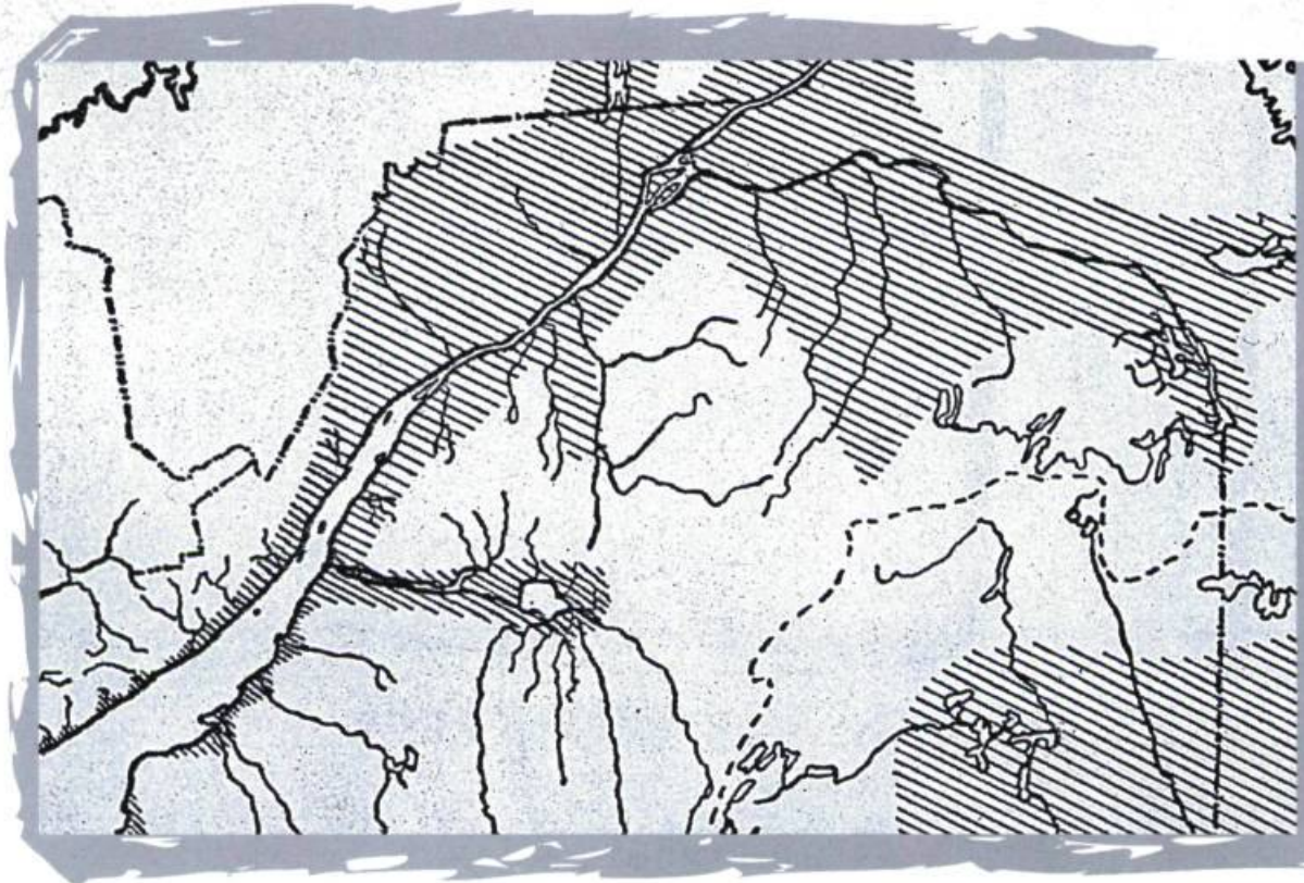
L'invasion marine maximale de la mer Champlain. Extrait de Initiation à la géologie de Laverdière.

Ces paysages sont marqués par une longue évolution géologique dont les principaux jalons sont : la création des Laurentides il y a plus d'un milliard d'années; l'invasion marine du Iapetus, au paléozoïque, il y a plus de 500 000 000 d'années; les glaciations du pléistocène il y a 1 600 000 ans; et