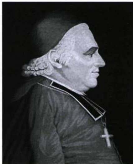
Mgr Plessis (Joseph Octave), vers 1810, attribué à Gerritt Schipper.

Ils étaient peut-être ignares et inculques (selon le Journal des visites pastorales ) mais, au moins, ils s'affichaient comme de bons chrétiens, dignes fils des missionnaires... «Mais si les Acadiens ignoraient les