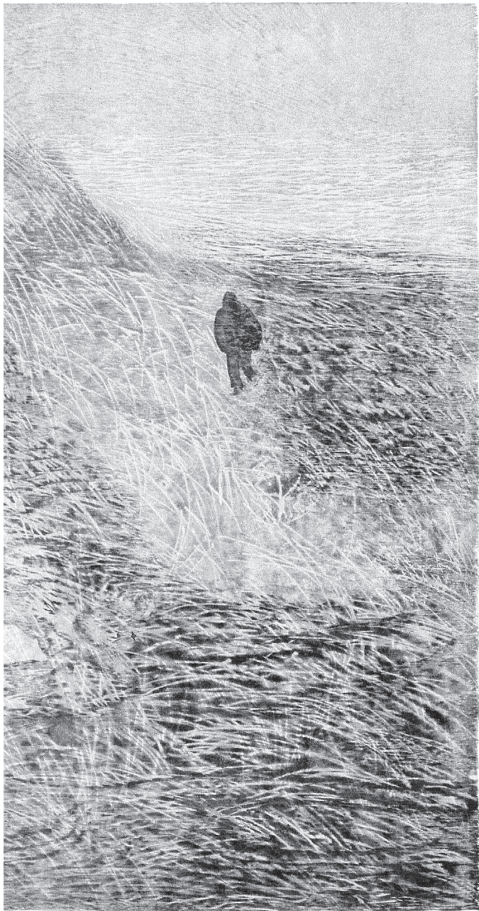
René Derooin, Martin cristallin .

possible dans les milieux où les soignants doivent composer avec les limites du temps alloué au service de chacun, le manque de personnel et les restrictions budgétaires ? Dans le contexte actuel, et pour la plupart des équipes de travail, l'accomplissement des tâches reliées aux soins triomphe de l'attention portée aux malades. La qualité relationnelle est considérée comme un privilège, voire un luxe, difficilement accessible en dehors des unités de phase terminale. Le témoignage des patients et de leurs proches en font foi.