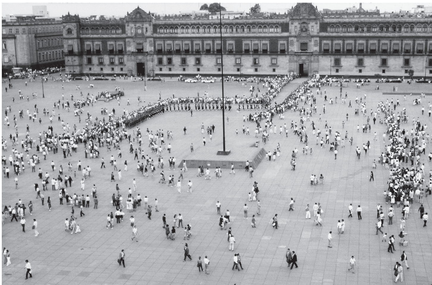
Plaza de la Constitución (Zócalo) Mexico.

La mort d'un collègue suscite des réactions fort variées dans les milieux de travail depuis la quasi-indifférence jusqu'au deuil profond. En effet, il est possible que des collègues en soient venus à développer, à force de complicités et de partage de préoccupations ou d'idéaux, des liens d'attachement profonds. Ces relations significatives sont même mises de côté quand la maladie à issue fatale prend place. La famille et le personnel médical ne pensent pas que ces relations peuvent être parfois même plus