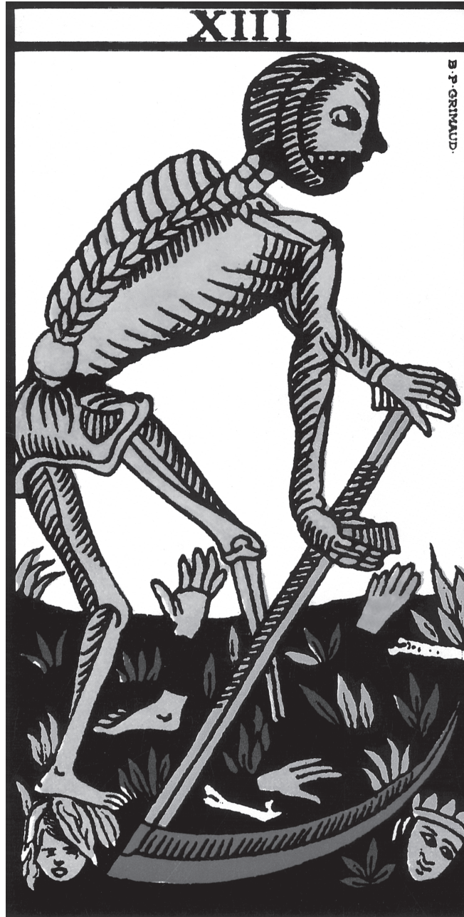
B.P. Grimaud, Ancien Tarot de Marseille, 1930

la vie. « La mort » entre ainsi dans le domaine dicible et, se matérialisant, peut être nommée. « La nomination est l'affaire du discours universel, du discours commun à tous » (Descombes, 1997, p. 47). Ce discours commun sur la mort, le Tarot parisien anonyme le fait éclore en moi , en tel lieu, tel moment, tel instant de la traversée d'un seuil d'existence. La mort dit ce qui en moi dit nous et ce qu'elle dit vaut pour tous.