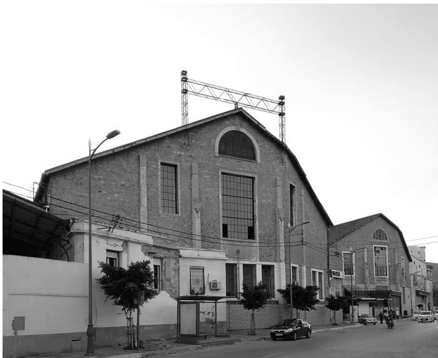
Figure 2. Docks Coopérative Tabacoop.

planteurs autochtones, était replanté pour sa convenance à l'exportation (Chevalier 1927 : 540-541). De même, les génétistes de l'institut de recherche cotonnière et textile « I.R.C.T » combinaient les semences de coton pour une fibre meilleure.