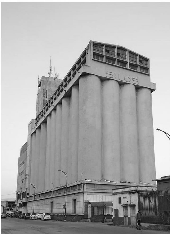
Figure 3. Silos coopératives du port d'Annaba.

et délivré 1340 diplômes d'ingénieurs... Elle n'avait toutefois formé que 5 ingénieurs d'origine algérienne qui furent les premiers cadres de l'agriculture ». Ainsi, l'interdit de qualification pour les algériens pose le problème de participation dans l'évolution des pratiques dans n'importe quel secteur, et confirme pour autant l'impossibilité de transfert technologique.