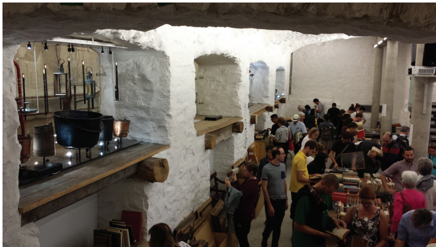
Figure 5. Vente publique dans les voûtes du Monastère.