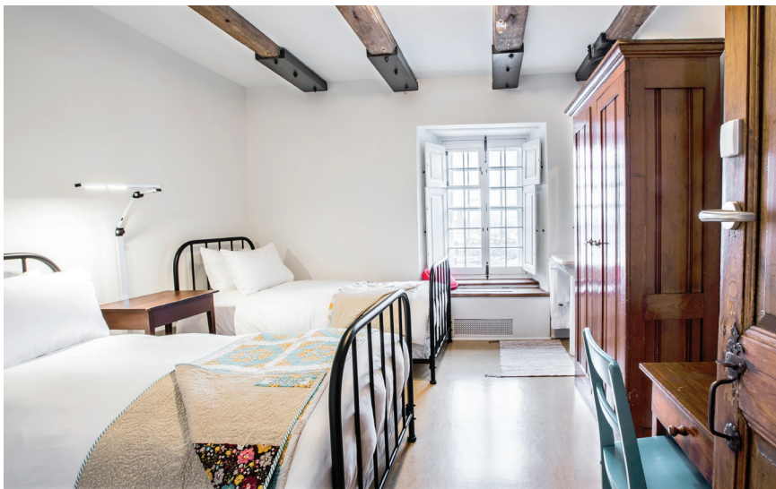
Figure 3. Chambre authentique. Le Monastère des Augustines.