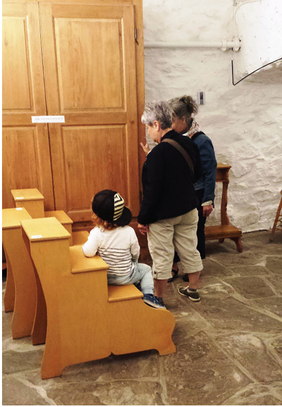
Figure 6. Acheteurs potentiels regardant une armoire portant l'étiquette « Je ne suis pas à vendre ».

religieux blanc est descendue dans les voûtes. Facilement identifiable dans la foule, quelques acheteurs s'empressaient d'échanger avec elle. La religieuse devenait par sa seule présence la représentante de toute sa communauté. On lui adressait un remerciement, on lui confiait que c'était un privilège de pouvoir accrocher chez soi un encadrement provenant de la communauté ou on échangeait avec elle à propos d'une cousine ayant étudié les soins infirmiers avec une augustine aujourd'hui décédée. L'expérience de l'acheteur était alors bonifiée par cette rencontre fortuite.