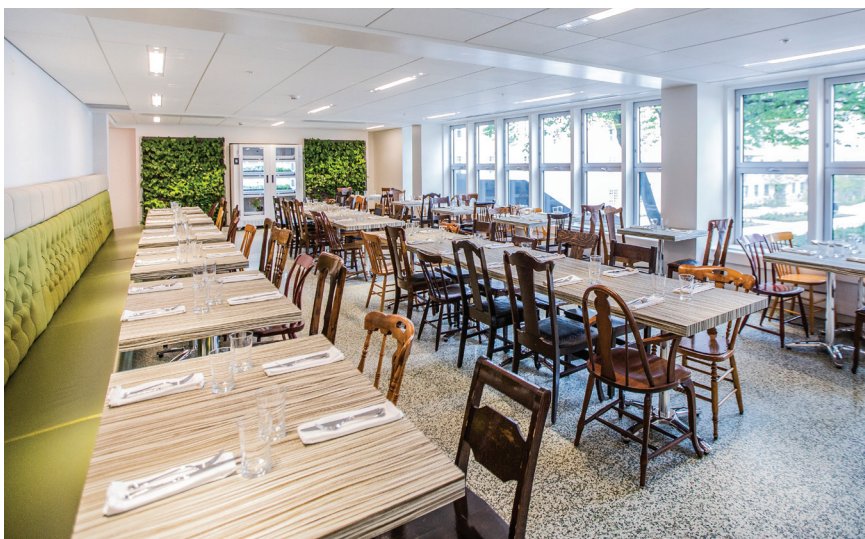
Figure 4. Salle à manger du restaurant. Le Monastère des Augustines.