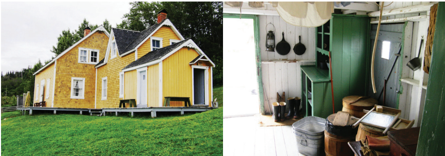
Figures 2. La maison Blanchette, à Grande-Grave, Parc national Forillon, une maison de pêcheur-agriculteur complètement remeublée sous forme d'un "musée de plein air".

Dès 1975, l'historienne Francine Lelièvre – aujourd'hui directrice du Musée d'archéologie et d'histoire Pointe-à-Callière, à Montréal – est choisie par Rivard pour s'attaquer à ce grand projet de valorisation ethnologique, soutenue par les importantes ressources professionnelles des équipes d'interprétation, d'ethnologie et de conservation de Parcs