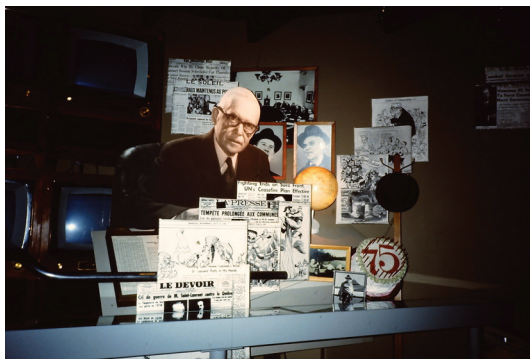
Figures 1. La maison Louis-S. St-Laurent à Compton, la chambre où est né l'ancien premier ministre du Canada et une vue du spectacle multimédia présenté sur sa vie dans le hangar attenant au magasin général de son père.