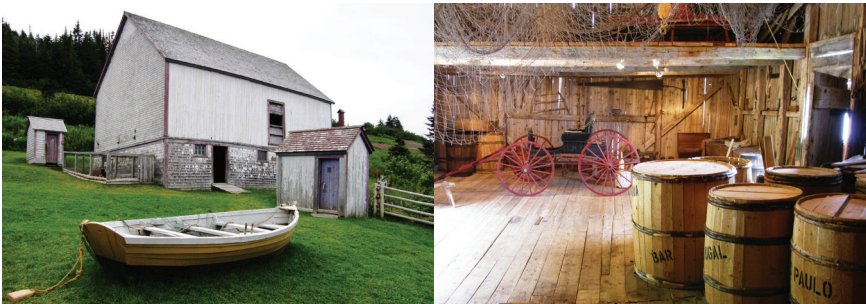
Figures 3. La grange-étable de l'anse Blanchette et son exposition d'interprétation à l'étage, dans le fenil.