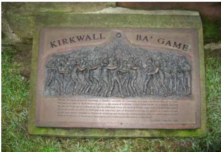
Photo 1 : plaque commémorative marquant le lieu de départ du « ba' game », devant la cathédrale de Kirkwall. Crédits : Laurent-Sébastien Fournier, 2007.

Rédigé par un érudit local qui a publié un livre de référence sur le jeu (Robertson 2005), le texte fait mention des deux équipes en présence qui sont appelées aussi les « Uppies » et les « Downies » sur le terrain. Il insiste sur les caractéristiques sociales et historiques du jeu, et en révèle l'originalité saisonnière et spatiale 4 . Associé à l'hiver, saison festive dans les sociétés traditionnelles où l'été est largement occupé par les travaux des champs, le jeu se déroule directement dans les rues du village, à la différence des sports de masse contemporains qui nécessitent un espace séparé. Le ballon est lancé au centre du village, près de la cathédrale, par un personnage officiel et neutre. Les « Uppies », venus du haut du village, doivent rapporter le ballon dans leur camp, à la sortie sud de la ville, près des vestiges d'un château, tandis que les « Downies » doivent le ramener au nord de la ville, dans l'eau du port (figures 1 et 2). Le jeu se joue avec un ballon du diamètre d'un ballon de football, fabriqué avec un savoir-faire spécifique. Quelques jours avant la Noël, les agents de voirie de Kirkwall se mettent à préparer l'espace de jeu. Quelques guirlandes décorent les rues, mais ce sont surtout les barricades (photo 2) qui sont caractéristiques. Destinées à éviter les vitrines brisées en