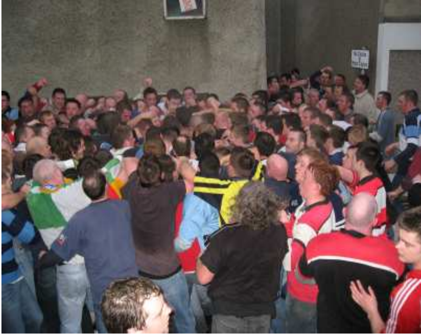
Photo 3 : mêlée, Kirkwall.

Au bout d'une vingtaine de minutes, la masse des corps échauffés laisse échapper un nuage de vapeur qui épaissit l'air glacé de l'hiver. À force de cris et de poussées acharnées, une équipe entraîne la mêlée vers une rue étroite qui accède à son quartier. Chaque pied de terrain donne lieu à une résistance tenace. Parfois, la mêlée se rompt et quelques joueurs en extraient le ballon, courent, se sauvent par une ruelle vers une arrière-cour, vite rejoints par leurs adversaires qui reforment alors la mêlée. Ce type d'action, qualifié de « contrebande » ou de « fraude » 5 est très important dans la dynamique du jeu car il peut soudain en précipiter l'issue, sous la forme d'une course folle vers les buts.