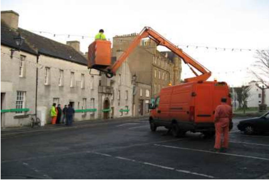
Photo 2 : préparation de l'espace de jeu et barricades de protection pour les fenêtres des habitations, Kirkwall.

contenant les coups d'épaules des joueurs et la pression de la foule, elles sont posées à chaque fenêtre selon un ordre imperturbable, dans toute la ville.