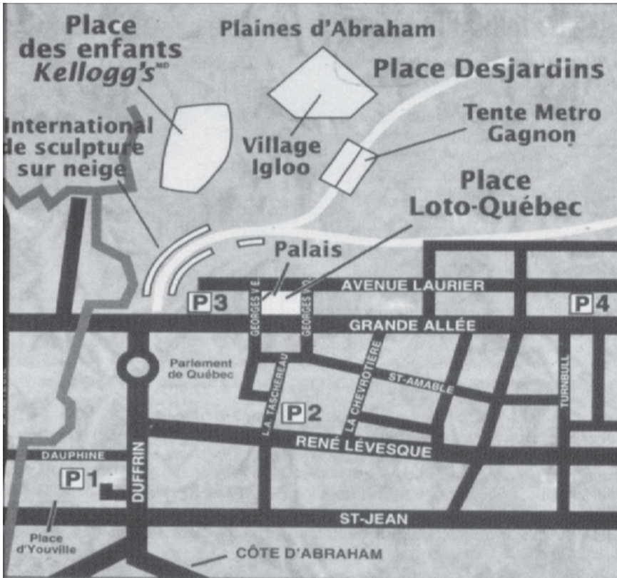
Figure 5. Carte officielle du Carnaval (Carnaval de Québec Kellogg's 1998 : 5). La Basse-ville est exclue ; la rue Saint-Jean marque la frontière sud du Carnaval officiel. C'est là que le « décarnaval » a choisi de se produire.

Médiateur entre « le pouvoir » et « le peuple », entre l'Économie et l'Identité, négociateur entre Kellogg's et les Knuks , entre la Haute et la Basse ville, l'acteur du Château détient tout le potentiel de l'acteur carnavalesque, médiateur entre « le Haut » et « le Bas » (Bakhtine 1970).