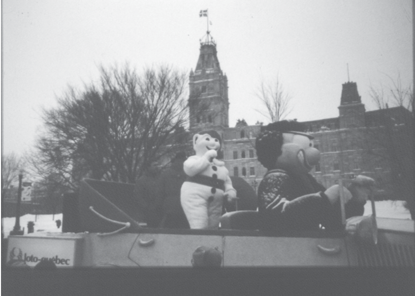
Figure 7. Le roi carnavalesque quitte la Colline parlementaire pour la clôture officielle à Place Hydro-Québec. Le Parlement, toutefois, ne déménage pas à Limoilou.