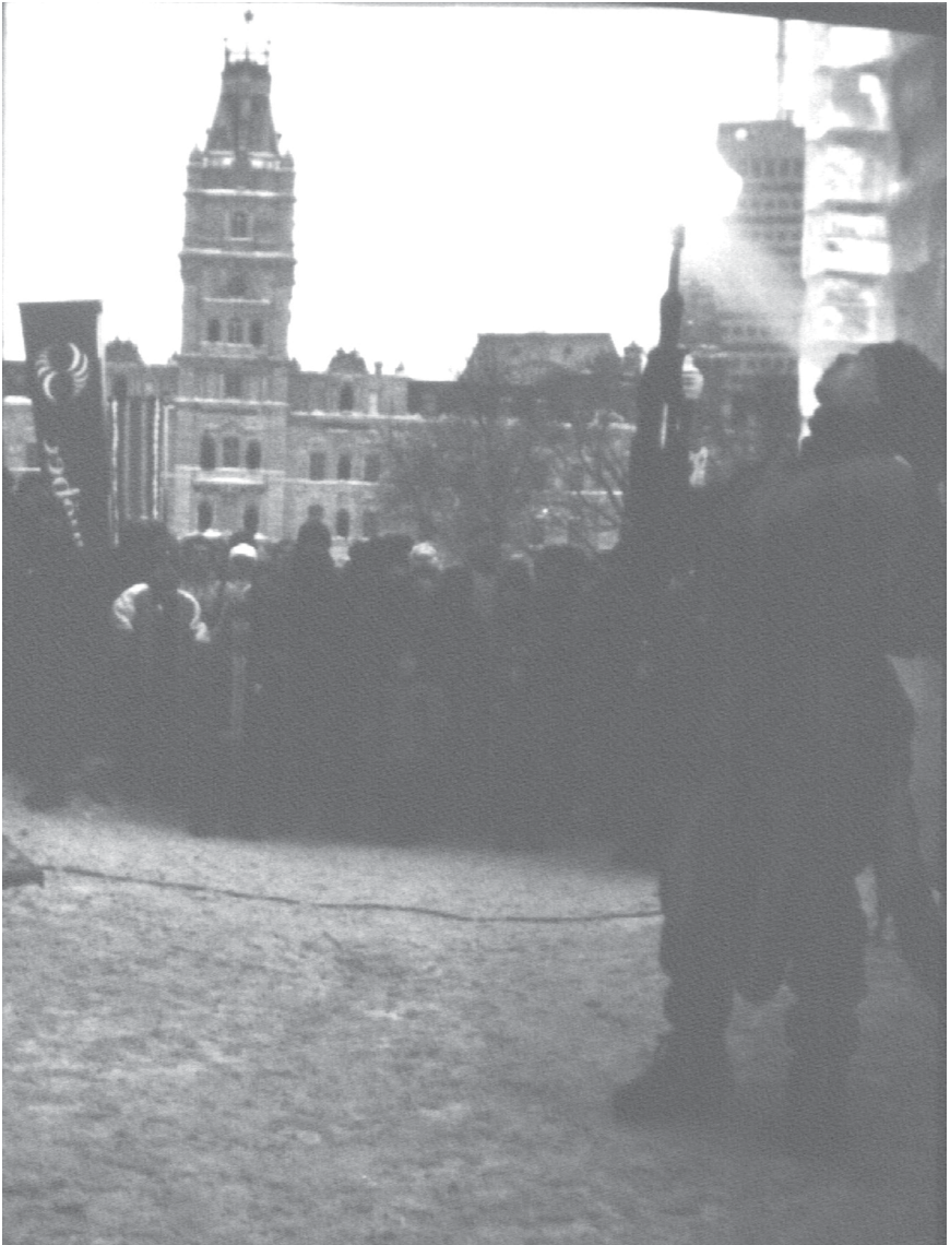
Figure 6. Le cracheur de feu entre le Château du Bonhomme et le Parlement. Médiateur entre le « pouvoir » et le « peuple », entre l'Économie et l'Identité, entre la Haute ville et la Basse-ville, l'amuseur public négocie des systèmes de représentations disparates, opposées autrefois entre le « Haut » et le « Bas ».