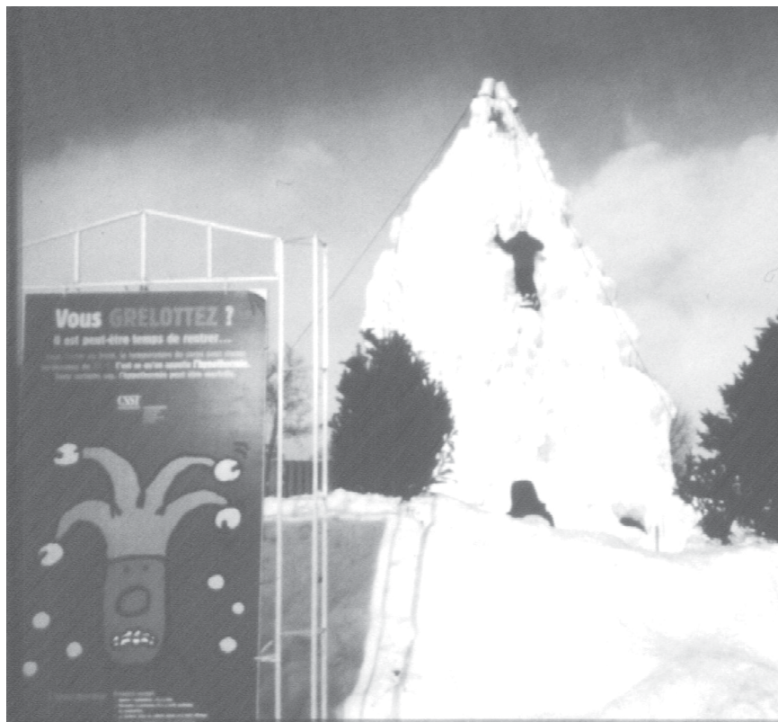
Figure 3. L'hiver, c'est froid !

Lors d'une « aventure hivernale » réinventée, les panneaux d'avertissement ramènent le carnavalesque à la réalité, l'invitant à rentrer à la maison.