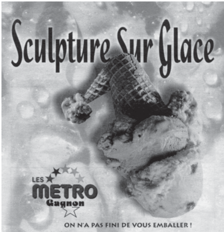
Figure 2. Dimensions économiques de la culture de la glace.

bonhomme de McDonald, qui nous sourit gaiement depuis la patinoire de Place Desjardins. Ainsi, le symbole identitaire local nous renvoie, avec insistance, aux emblèmes de la mondialisation. Paradoxalement, la symbolique de la glace nordique, représentation québécoise par excellence, fait glisser le Bonhomme vers le royaume de McWorld .