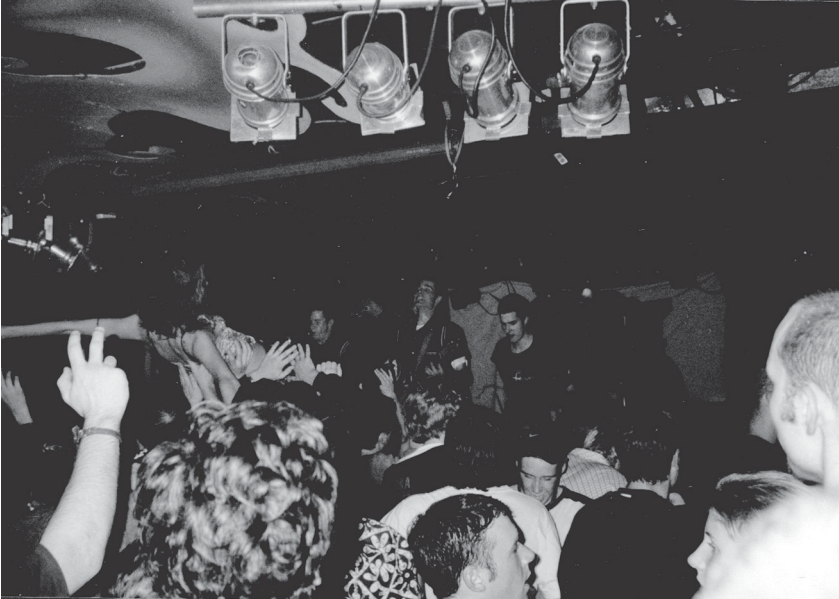
Figure 9. La plongée des fans symbolise à la fois le refus du statut de spectateur et l'affirmation de sa propre identité dans le corps commun des semblables.

Dans une logique carnavalesque, le slamer renverse l'ordre symbolique par son propre corps physique, par ses mouvements « non-normatifs ». La vague désordonnée et « dé-hiérarchisante » du pogo véhicule ainsi toute une vision anarchique du monde social.