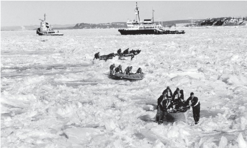
Figure 1. Course en canot sur glace.

tournent autour de la construction du paradigme identitaire nordique : sculptures sur neige, village des igloos, résidence du Bonhomme, omniprésence du Bonhomme, la mascarade des « Knuks » (présentés comme « peuple habitant un petit village du cercle polaire, camouflé sous une gigantesque coupole de glace »), mini-golf sur glace, escalade sur glace, tir sur neige, planche à neige, tournoi de balle sur neige, course en canot sur glace, course de traîneaux à chiens, course d'automobiles sur glace, « Classique » de ski de fond, bain de neige, traversée du pont de glace, « Les anciens Nordiques contre équipe