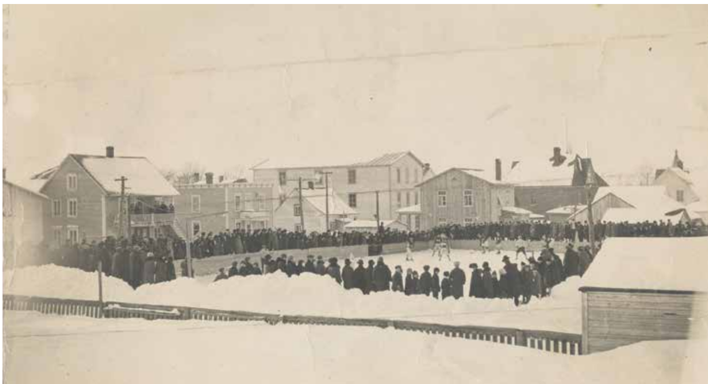
Patinoire extérieure de la rue Vézina à Trois-Pistoles entre 1924 et 1929