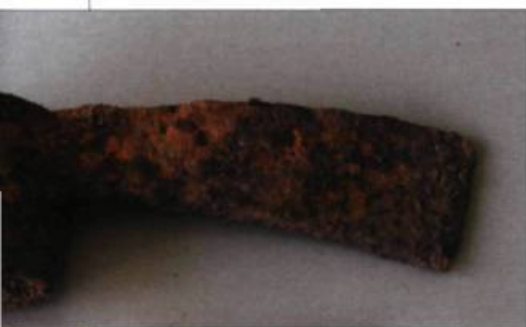
Hache retrouvée au niveau d'une stratification de terre datée de 1440-1530 lors des fouilles du site de Cap-Rouge à l'été 2006.