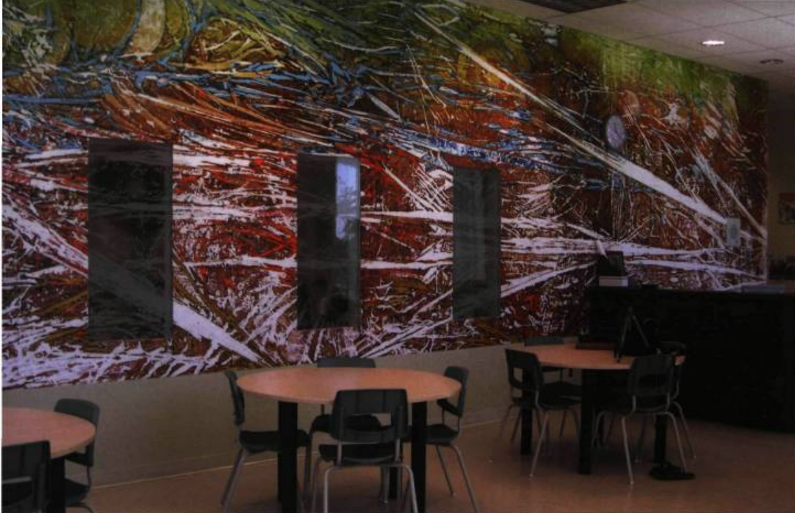
Œuvre réalisée par Marcel Saint-Pierre et installée en 2004 à l'École des Deux-Ruisseaux, à Gatineau. Succession jaune-vert-mauve est une peinture sur toile qui contient des insertions de verre.