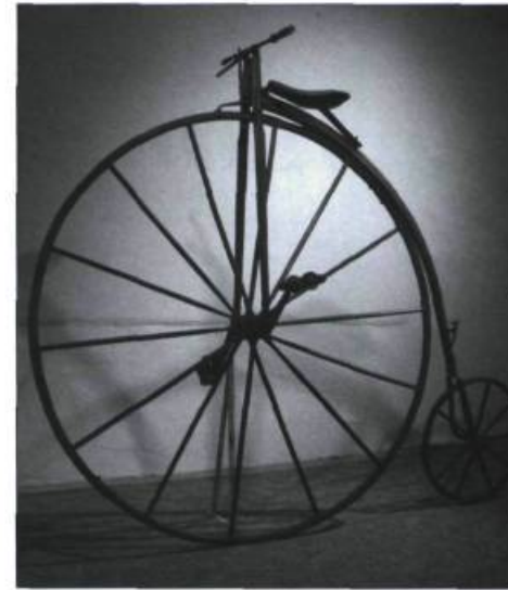
Bicyclette datant de la deuxième moitié du XIX e siècle. Faites de métal et de bois, une bicyclette coûte à cette époque entre 100$ et 175$ et son poids varie de 27 kg à 44 kg.

Information: (514) 861-3708 ou www.chateauramezay.qc.ca