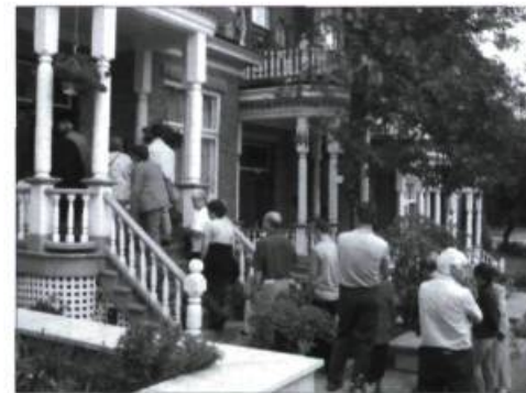
Visite d'intérieurs anciens à Beauport.

Information : (418) 647-4347, 1 800 494-4347 ou www.cmsq.qc.ca