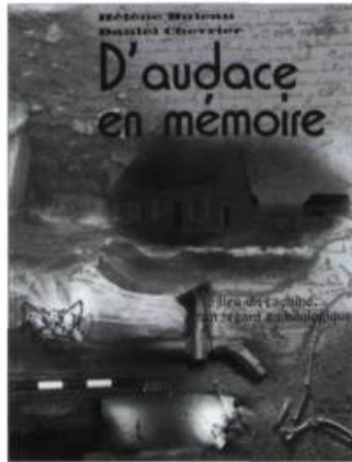
Le lieu dit Lachine, un regard archéologique , Montréal, Art Gestion, coll. « In Situ », 2001, 56 pages, 18,69 $.