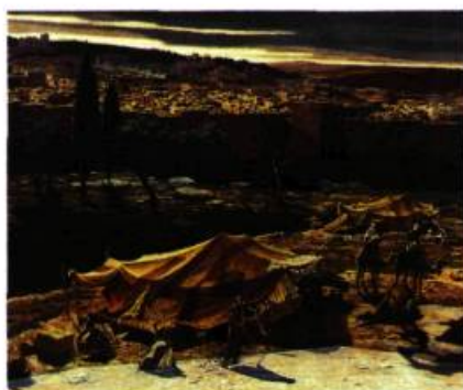
Les tentes des marchands arabes – les «faux terrains» – sont particulièrement remarquables pour leur rendu.