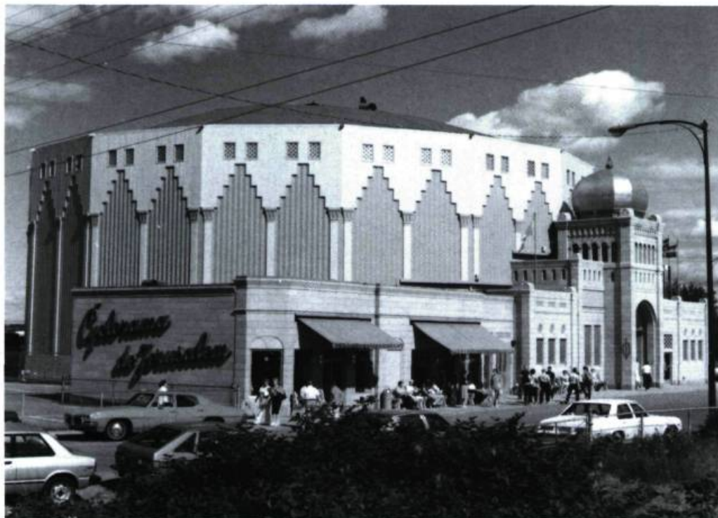
La rotonde qui abrite le Cyclorama de Jérusalem, à Sainte-Anne-de-Beaupré.

Un spectacle fascinant, unique au Canada, qui nous transporte par la magie du trompe-l'œil sur les lieux mêmes de la mort du Christ.