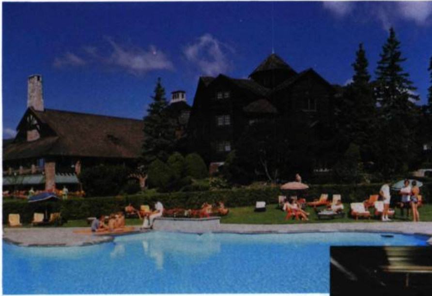
Le château Montebello, l'hôtel québécois qui, historiquement, semble avoir offert la plus grande variété d'activités à ses clients.