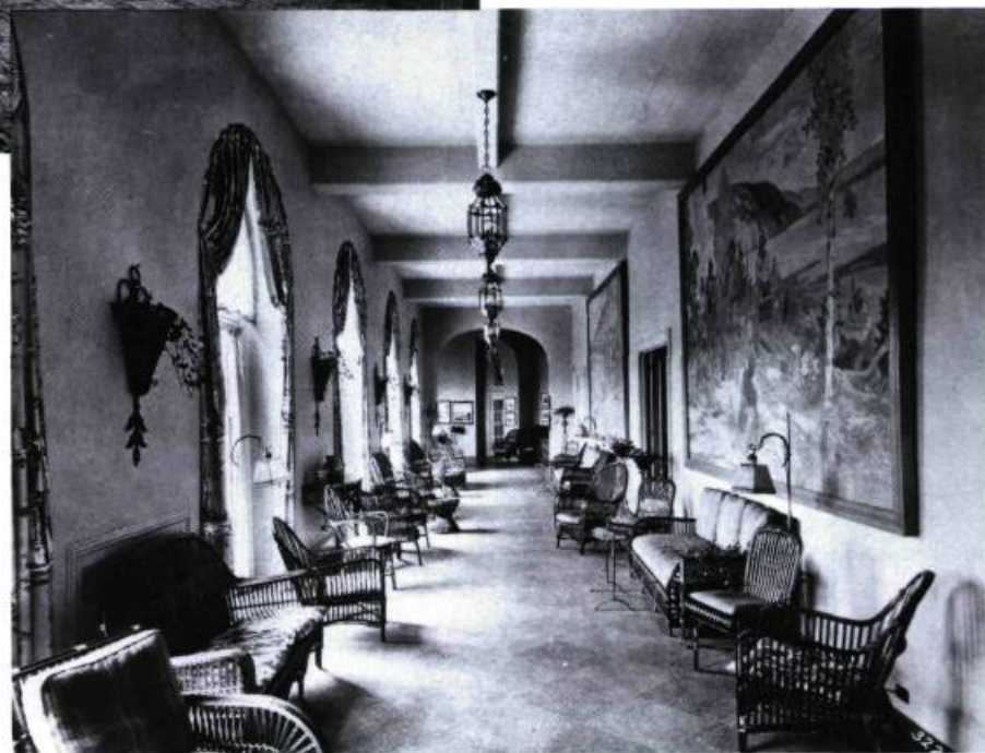
Les aires de récréation des hôtels baignent dans une lumière crue et revigorante. Vue ancienne du manoir Richelieu.