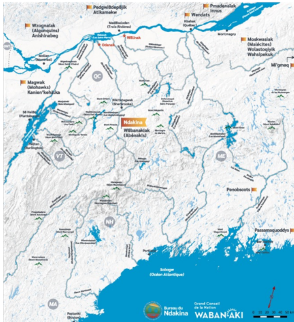
Figure 1. Ndakina, le territoire ancestral de la Nation w8banakii

inspirée des travaux de Terry Tobias pour identifier des impacts que des projets pourraient avoir sur les activités dites « alimentaires, rituelles ou sociales » des membres de la Nation (Tobias 2000; GCNWA 2016). Ces études documentent et cartographient cinq principales catégories d'activités : la chasse, la trappe, la pêche, la cueillette et la collecte et d'autres activités culturelles ou rituelles. Cette base de données, mise à jour en continu depuis, sert de point de départ au Bureau pour comprendre l'expression contemporaine de la territorialité w8banakii, de ses modalités (c'est-à-dire les formes particulières que prend cette territorialité aujourd'hui, notamment les moments de la vie et de l'année, les circonstances et les raisons qui mènent les w8banakiiak à se rendre sur le territoire) et ses conditions sous-jacentes qui permettent son expression et sa transmission.