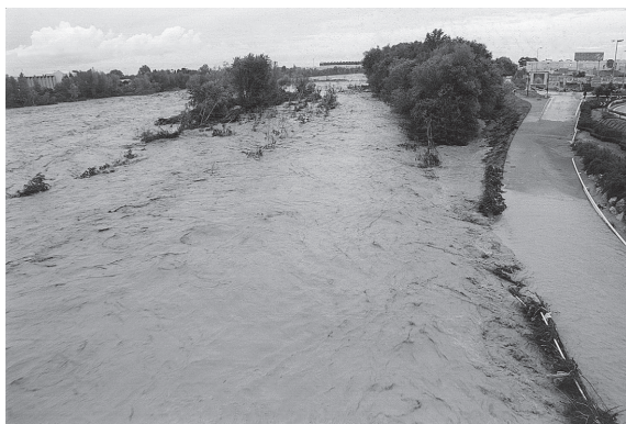
Figure 1 L'autoroute A8 à proximité du centre administratif de Nice, 5 novembre 1994

Un exemple: la crue spectaculaire du Var, le 5 novembre 1994, à Nice. Cette crue provoque l'inondation de l'aéroport, de la cité administrative, du marché d'intérêt national et du quartier de Nice-Ouest, de même que la rupture de la voie sur berge d'accès à l'aéroport (figure 1). Deux facteurs permettent de l'expliquer: l'urbanisation de la basse vallée, bien sûr, mais aussi des aménagements successifs (endiguements, extractions, construction des seuils et des microcentrales, etc.) qui ont artificialisé le lit du Var. Le fleuve a remodelé sa morphologie (baisse de la nappe, chenalisation du lit, développement de la végétation, débordements en crue, enfoncement à l'aval, érosion, engravement des seuils en amont, remontée du lit) pour s'adapter à ces perturbations anthropiques. Cela expose la vallée à des risques accrus d'inondation.